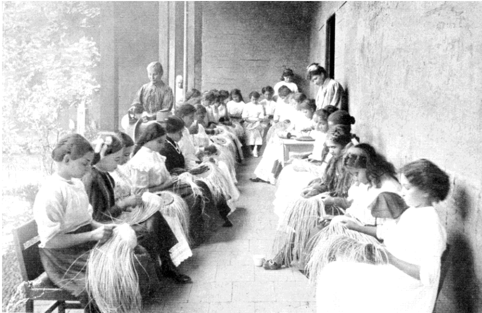
Mujeres trabajadoras de la industria textil.

se exaltaban para contrarrestar el consumo de alcohol eran los propios de la "antioqueñidad": familia, religión, raza y dedicación al trabajo 17 .