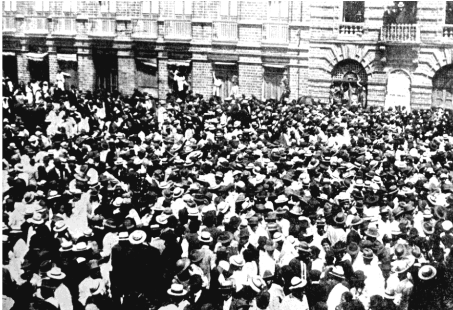
Manifestación en Medellín, marzo de 1920, en apoyo a las huelguistas de Bello. El Gráfico , No. 521, abril 10 de 1920.

hallaba otro grupo numeroso de gentes que recibió con vivas entusiastas a los obreros huelguistas" 33 .