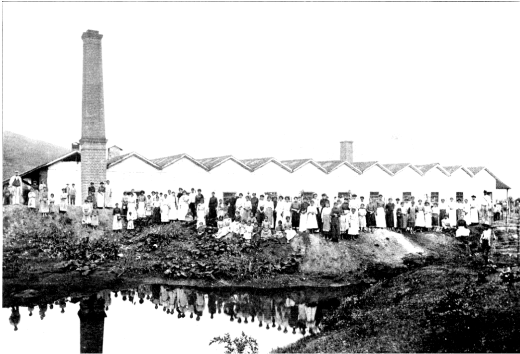
Edificio de la Compañía de Tejidos de Bello, Medellín 1910.

palabra gráfica y contundente: una montonera de niñas astrosas y mirrianas, que recibían una ración de hambre y una diaria lección de rebeldía contra las injusticias humanas" 8 .