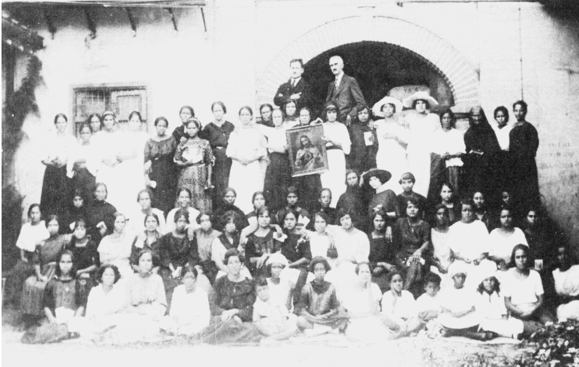
Símbolos y ritos católicos fueron introducidos en las fábricas antioqueñas, para inculcar sumisión y obediencia de las mujeres trabajadoras. Eso se observa en la foto de la Trilladora de Ángel López. Historia de Medellín , Tomo II, Compañía Suramericana de Seguros, Bogotá, 1996, p. 397.

Una parte del moralismo paternalista de los empresarios antioqueños, impulsado por ellos mismos, estaba encaminado a ligar la disciplina fabril a una red de normas disciplinarias de índole sexual. La otra parte del moralismo había sido promovida fuera de las fábricas desde la década de 1910 por la Acción Social Católica. Medellín, epicentro del catolicismo, se convirtió en un baluarte de la campaña moralista emprendida conjuntamente por la iglesia, sectores del Partido Conservador y damas de las clases dominantes, siendo la fábrica uno de sus objetivos prioritarios, puesto que era símbolo de la modernidad y de las peligrosas relaciones entre los sexos.