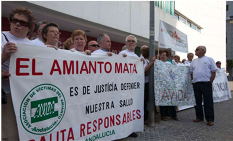
Manifestación en las puertas del Juzgado de Sevilla, 2013

Para terminares ilustrativo traer a colación la imagen de los trabajadores de la fábrica Uralita de Sevilla, ya damnificados, ante las puertas del Juzgado reclamando justicia contra Uralita porque “el amianto mata”.