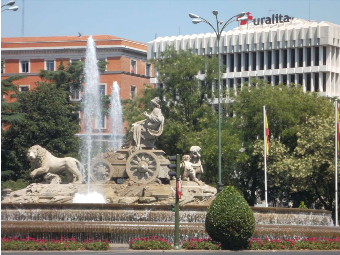
Foto tomada por el autor en julio de 2014. En pleno centro del país, la Plaza de la Cibeles.

Pero todavía no se consideran vulnerables porque han cambiado el nombre pero mantienen el mismo logo.