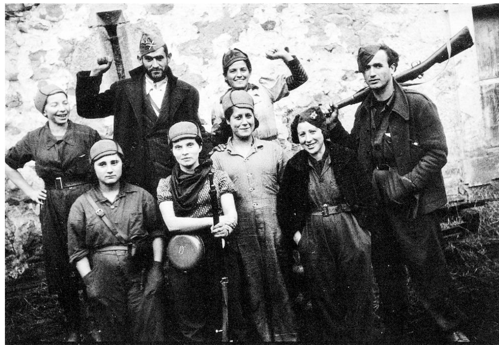
Foto: Milicianas comunistas en Asturias.

La República asegurará a todo trabajador las condiciones necesarias de una existencia digna. Su legislación social regulará: los casos de seguro de enfermedad, accidente, paro forzoso, vejez, invalidez y muerte; el trabajo de las mujeres y de los jóvenes y especialmente la protección a la maternidad; la jornada de trabajo y el salario mínimo y familiar; las vacaciones anuales remuneradas; las condiciones del obrero español en el extranjero, las instituciones de cooperación; la relación económico-jurídica de los factores que integran la producción; la participación de los obreros en la dirección, la administración y los beneficios de las empresas, y todo cuanto afecte a la defensa de los trabajadores.