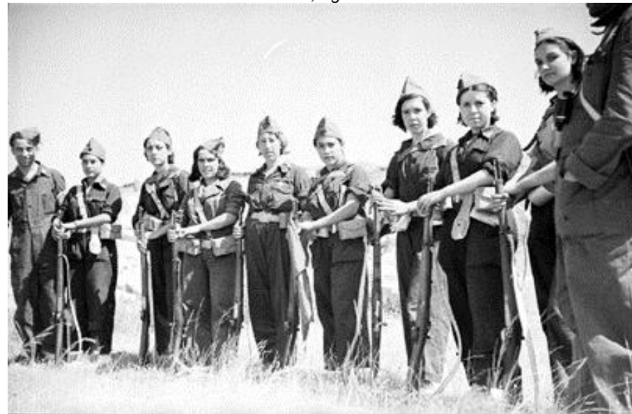
Foto: Las reclutas del Batallón Acero al completo en un lugar de la Sierra de Guadarrama