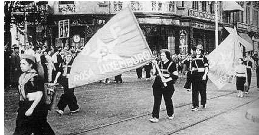
Foto: Milicianas en Barcelona