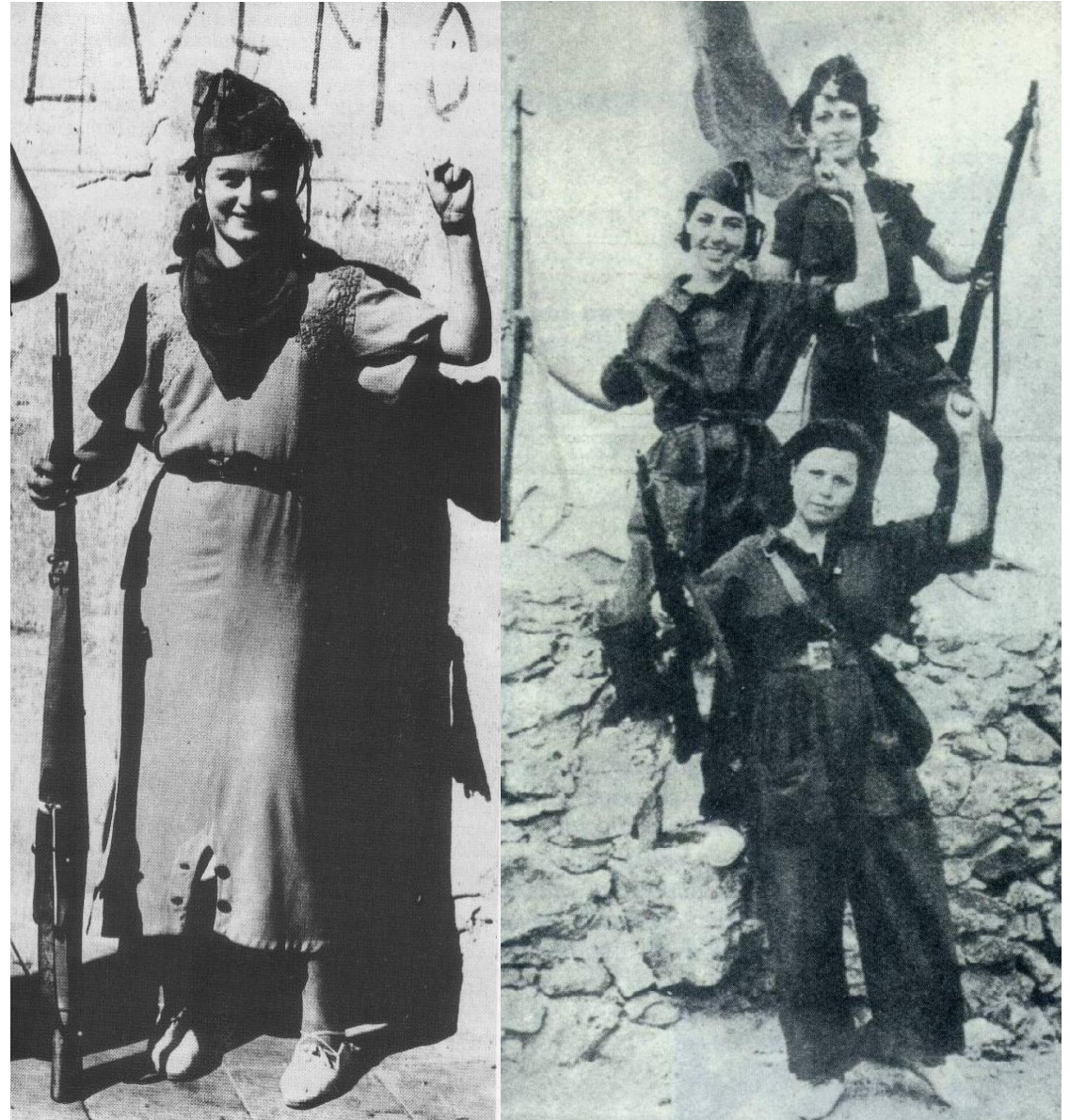
Foto izquierda: Guadalajara, 1936. Imagen de dos milicianas del pueblo que participaron en la toma de Guadalajara.

Artículo 78°. El Presidente de la República no podrá cursar el aviso de que España se retira de la Sociedad de las Naciones sino anunciándolo con la antelación que exige el Pacto de esa Sociedad, y mediante previa autorización de las Cortes, consignada en una ley especial, votada por mayoría absoluta.