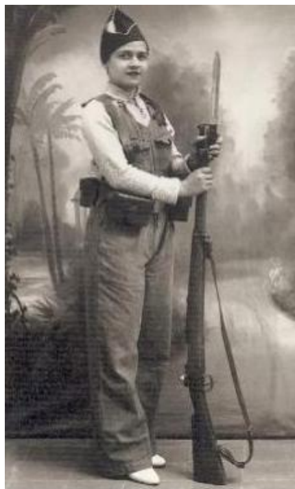
Foto: Miliciana, Albacete 1938

6ª. Obligación de rendir anualmente cuentas al Estado de la inversión de sus bienes en relación con los fines de la Asociación. Los bienes de las Ordenes religiosas podrán ser nacionalizados.