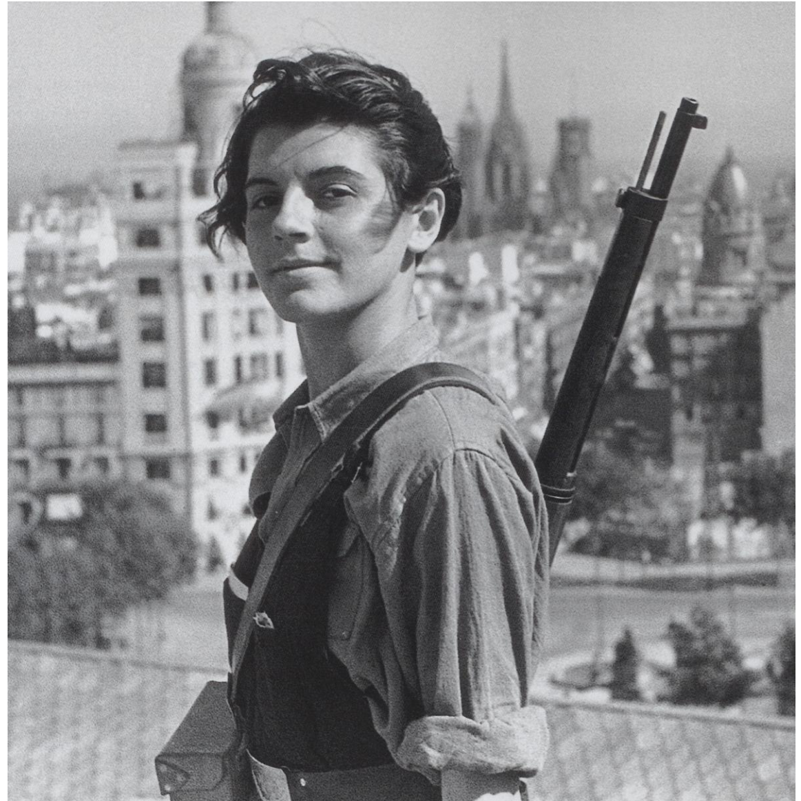
Foto: La miliciana Marina Ginestá, de la Juventudes Comunistas, en Barcelona.

Artículo 72º. El Presidente de la República prometerá ante las Cortes, solemnemente reunidas, fidelidad a la República y a la Constitución.