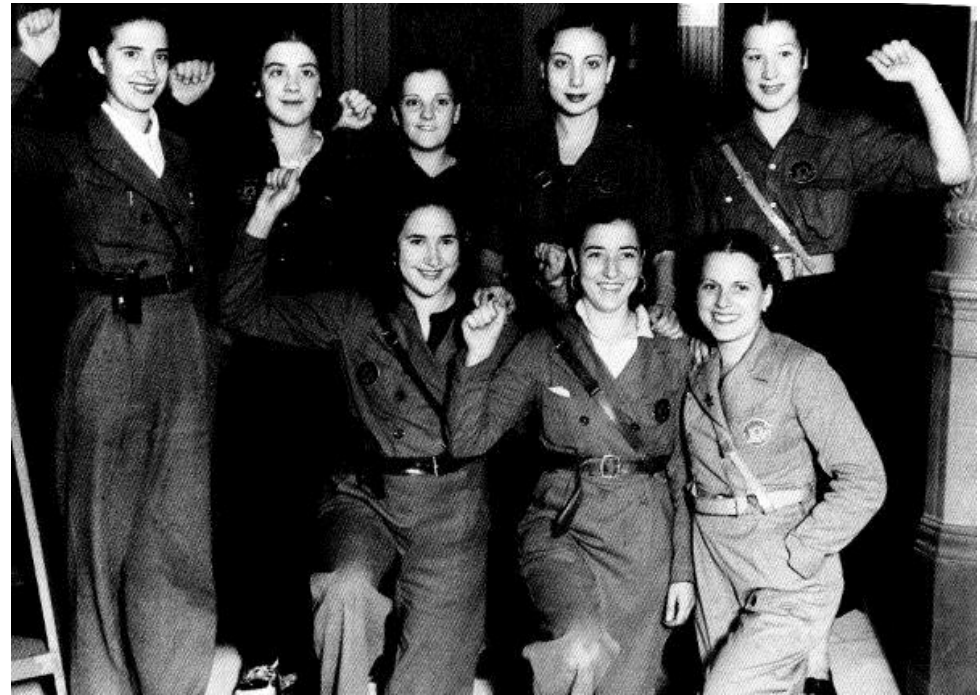
Foto: Milicianas en el teatro Lara

Artículo 50°. Las regiones autónomas podrán organizar la enseñanza en sus lenguas respectivas, de acuerdo con las facultades que se concedan en sus Estatutos. Es obligatorio el estudio de la lengua castellana, y ésta se usará también como instrumento de enseñanza en todos los centros de instrucción primaria y secundaria de las regiones autónomas. El Estado podrá mantener o crear en ellas instituciones docentes de todos los grados en el idioma oficial de la República.