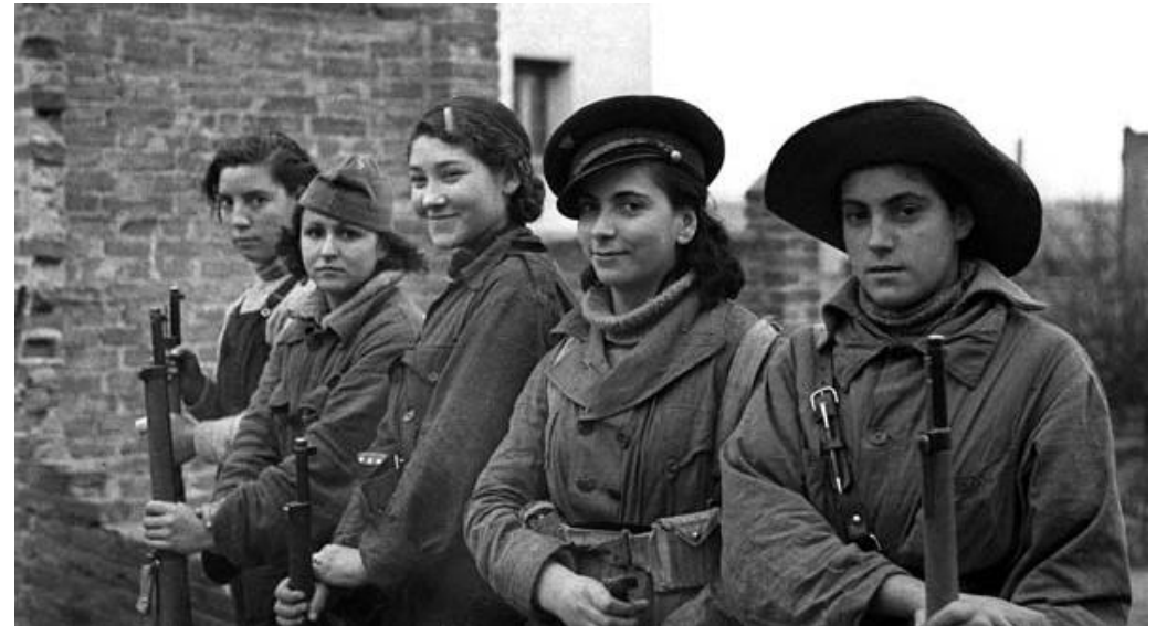
Foto: Mujeres republicanas en el frente de Teruel. La segunda comenzando por la derecha es Rosario Sánchez Mora, "La dinamitera".

El Estado protegerá también los lugares notables por su belleza natural o por su reconocido valor artístico o histórico.