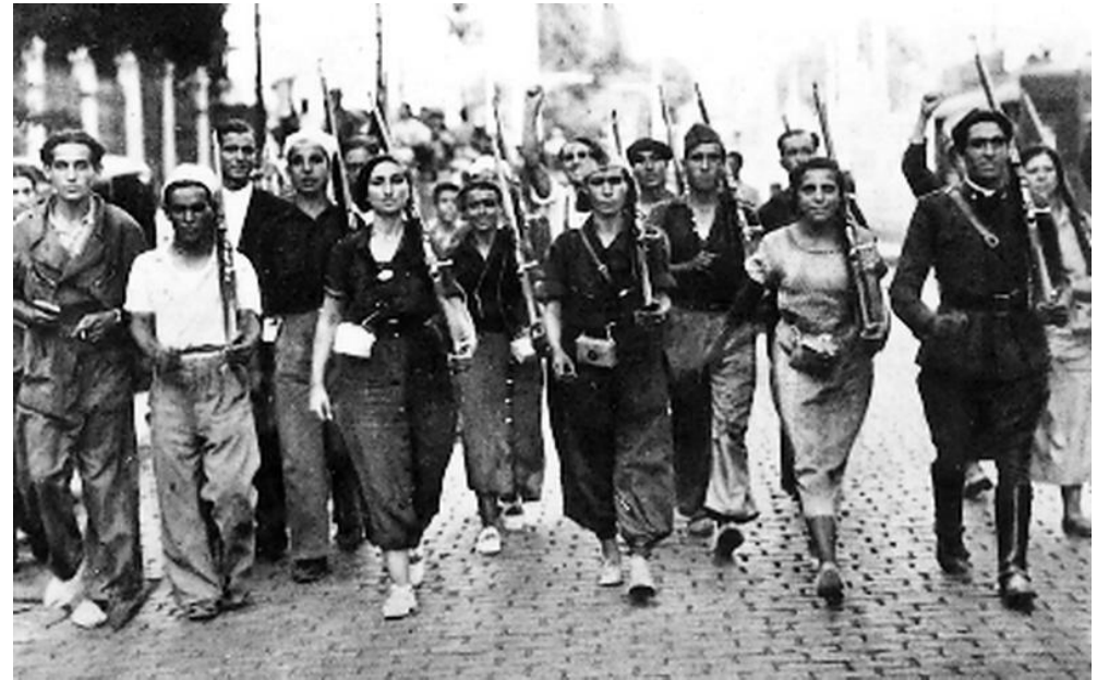
Fotos: Milicianas en Barcelona.

No podrá decretarse la suspensión de ningún periódico sino por sentencia firme.