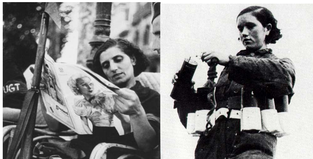
Barcelona agosto 1936