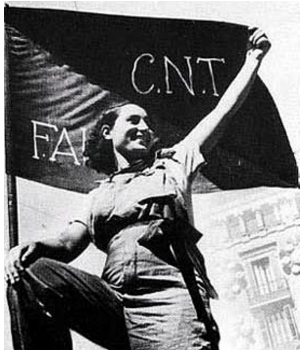
Foto: Miliciana anarquista

En estos mismos países, si sus leyes no lo prohíben, aun cuando no reconozcan el derecho de reciprocidad, podrán naturalizarse los españoles sin perder su nacionalidad de origen.