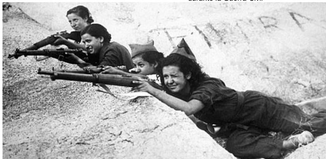
Foto: Milicianas en Somosierra 1936.