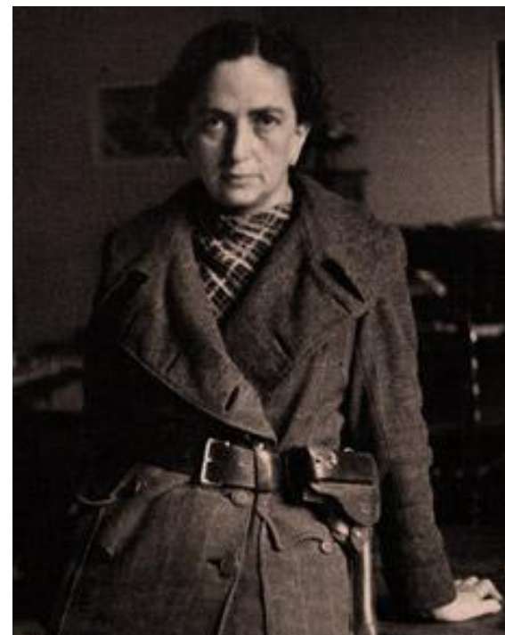
Foto: Micaela Feldman, capitana. durante la Guerra Civil