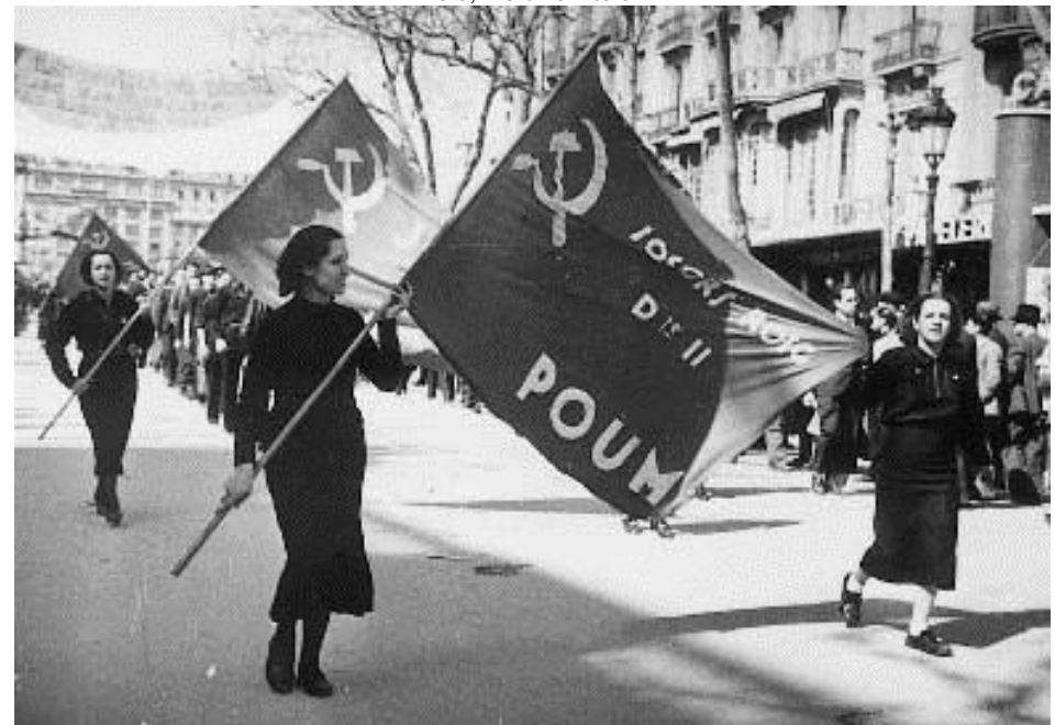
Foto: Mujeres del POUM