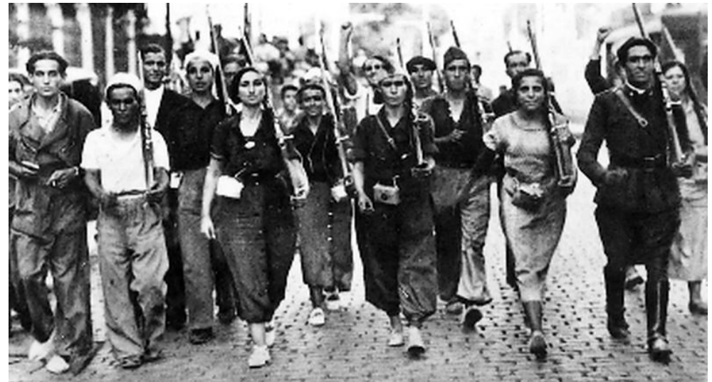
Foto: Milicianas en Barcelona.