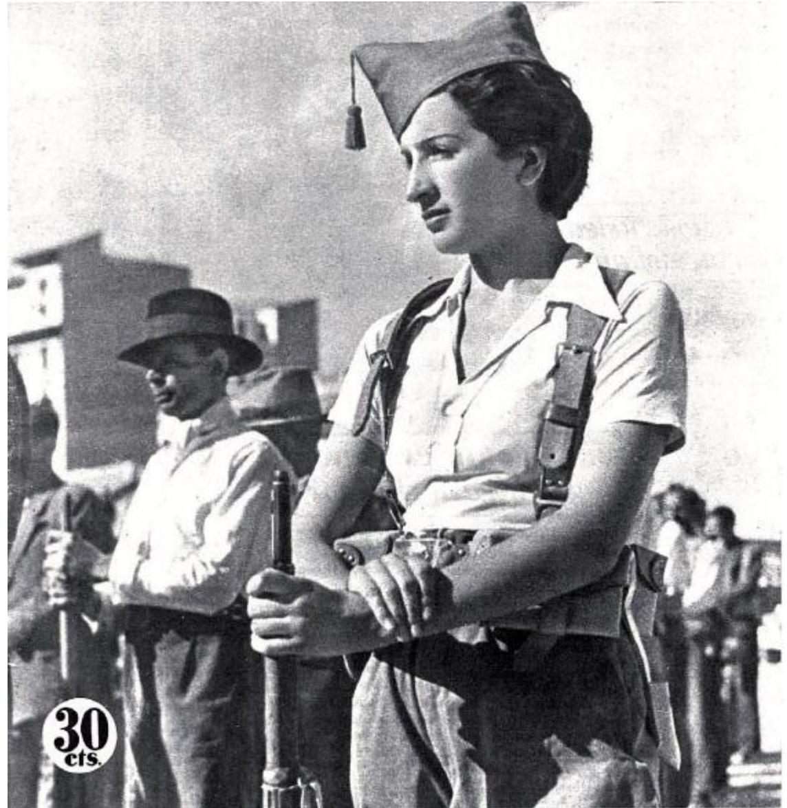
Foto: Miliciana del Batallón de acero haciendo instrucción en el cuartel de Francos Rodriguez, Madrid

Una vez aprobado el Estatuto, será la ley básica de la organización política administrativa de la región autónoma, y el Estado español la reconocerá y amparará como parte integrante de su ordenamiento jurídico.