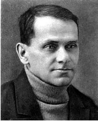
Pavel Blonsky (1884-1941). Ucraniano, participante de la lucha revolucionaria, fue el más destacado pedagogo y sicólogo de esta corriente. Se señala una amplia producción de más de 200 trabajo sobre psicología y educación. Fue el primer rector de la Academia de Formación Socialista (más tarde Academia N. Krúpskaya de Educación Comunista).

Para Blonsky, nuevamente se pone a la fábrica como el espacio educativo más idóneo para la formación polivalente, considerando que allí podrá ganar en disciplina, conciencia de sí mismo y un mayor nivel de libertad. Plantea estructurar el sistema a partir del jardín de la infancia, el “robinsoneo” en la colonia escolar, el internado de escuela de trabajo familiar y la escuela del trabajo para adolescentes ligada a la fábrica a través de una enseñanza interdisciplinar.