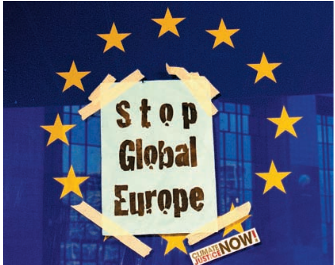
JUSTICIA CLIMÁTICA. La Presidencia española se enmarca en plena crisis económica, energética y climática.

La gran medida contra la crisis consiste en la puesta en marcha de organismos para regular los mercados financieros, aunque carece todavía de concreción y no parece que esté diseñada más que para contro-