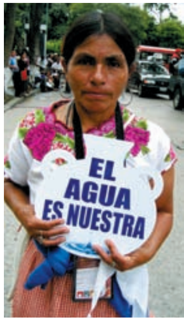
AGUA. Los TLC de la UE incluyen la privatización de servicios públicos básicos.

La presencia de delegaciones de América y Europa requiere del apoyo de todas y de todos. Se está creando una red de casas solidarias. Y se ha organizado un equipo para resolver las incidencias que puedan surgir en