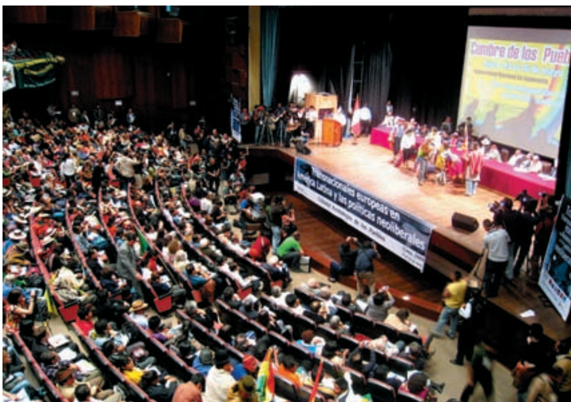
LIMA, 2008. Sesión de la Cumbre de los Pueblos Enlazando Alternativas III en la capital peruana.

El tribunal de Madrid sigue la senda de las dos sesiones anterior-