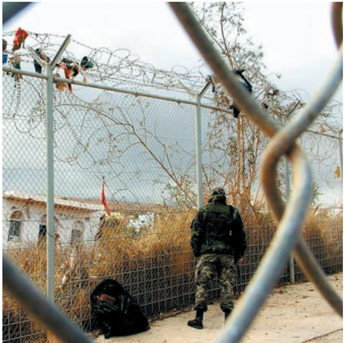
LA VALLA DE LA VERGÜENZA. La militarización de la frontera ha sido la reacción de la UE frente a la presión migratoria.

La Unión Europea lleva tiempo dominada por dos obsesiones: la defensa acérrima de la libre circulación de mercancías, capitales y servicios y la apuesta por políticas monetaristas que erradiquen la inflación y el déficit. Esas obsesiones, por miedo o por convicción, han sido asumidas por la mayoría de los Estados miembros, sobre todo en la eurozona. En ese contexto, sólo cabe concluir que el modelo económico impulsado por la UE es una amenaza en toda regla a los derechos sociales en el interior de los Estados y un obstáculo para el surgimiento de políticas sociales y ambientales robustas a escala europea.