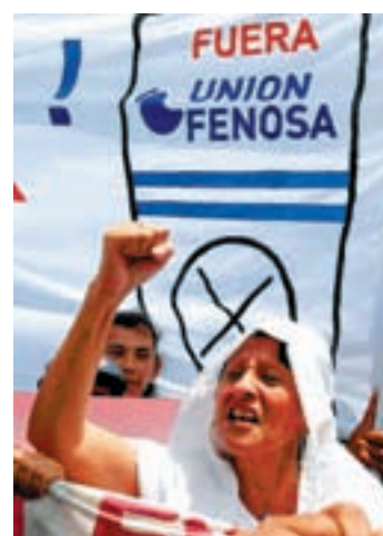
NICARAGUA, 2006. Protesta contra Unión Fenosa en Managua.

En la década de los 90, a raíz de la creación del Mercado Único Europeo y la consolidación del marco económico neoliberal (Consenso de Washington), se produce un proceso de apertura e