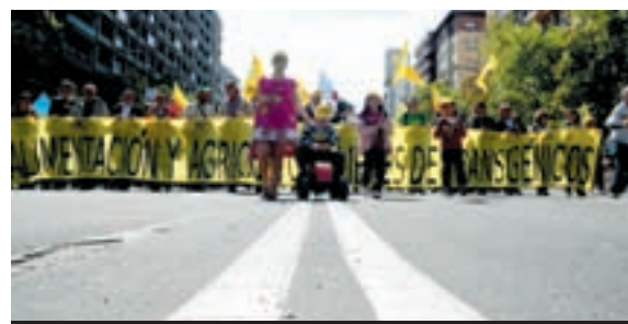
ZARAGOZA, ABRIL 2009. Manifestación contra los transgénicos.

El encuentro estatal "Activ@s contra la crisis" convoca una jornada de lucha y movilización, impulsando, entre otras acciones, marchas contra el paro, la crisis y el racismo, desde diferentes puntos de la península rumo a Madrid.