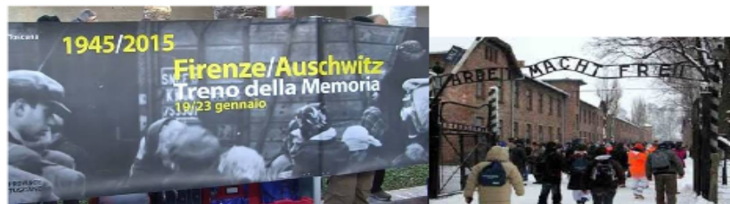
Programa anti nazi "Treno della Memoria" que se desarrolla en varias ciudades de la Toscana Italia

Para enfrentar y evitar el resurgimiento de un régimen racista y excluyente como fue el nazismo, no basta con hablar del tema en aulas , entonces en la región de La Toscana de Italia, cada año se organizan excursiones guiadas por sobrevivientes del holocausto dirigido a estudiantes y niños para que visiten los campos de concentración de Auschwitz Polonia , lo que se conoce como "Treno della memoria" con la intención de generar la conciencia y sensibilización a través de la memoria histórica a efecto de que nunca más retorne el nazismo . Este ejemplo permite comprender la importancia de tomar iniciativas similares para encarar y establecer una conciencia social frente a un mal social.