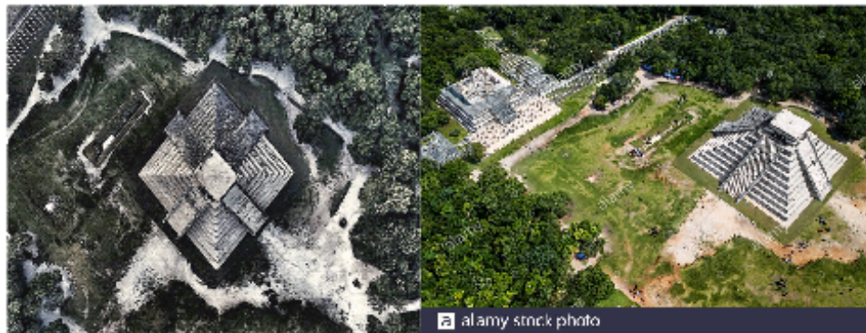
Pirámide Kukulcan Mexico

gregoriano que fuera modificado por orden el Papa Gregorio recién el año 1583 presenta un error cada 3.000 años, siendo aún mas inexacto el calendario que trajo Colon el cual tenia un error cada 128 años. De esta manera el calendario Maya tuvo una exactitud sorprendente gracias a la astronomía maya, sin embargo, Europa, desde el diario de Colon, solo menciona y divulga de los Mayas, Incas y otros como pueblos bárbaros o salvajes dedicados al sacrificio humano, como refleja la "película Apocalypto " dirigida por Mel Gibson haciendo eco de esta manipulación y menosprecio hacía un pueblo precolombino. Lo más lamentable resulta ser que muchos latinoamericanos creen en esta versión eurocentrista, ratificando de cómo han ido perdiendo la identidad cultural latinoamericana y en consecuencia también han ido perdiendo autoestima.