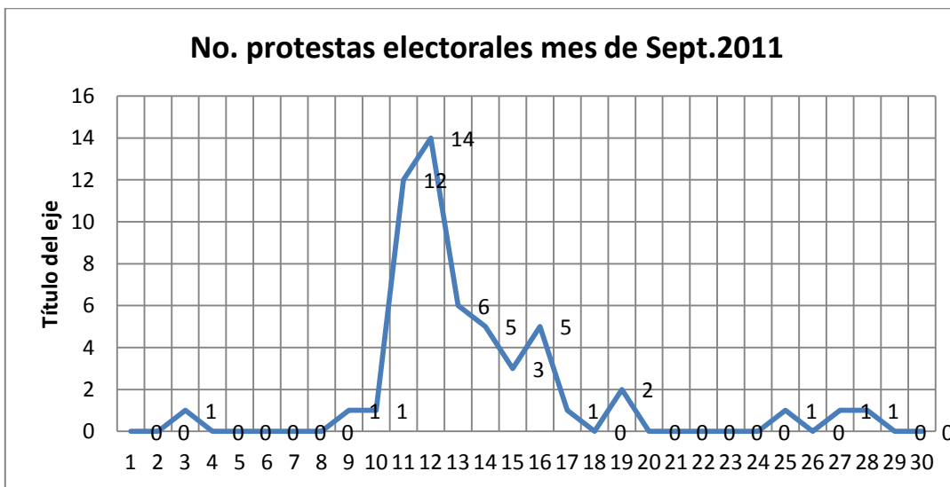
Gráfica No. 3 Número de protestas mes de septiembre 2011