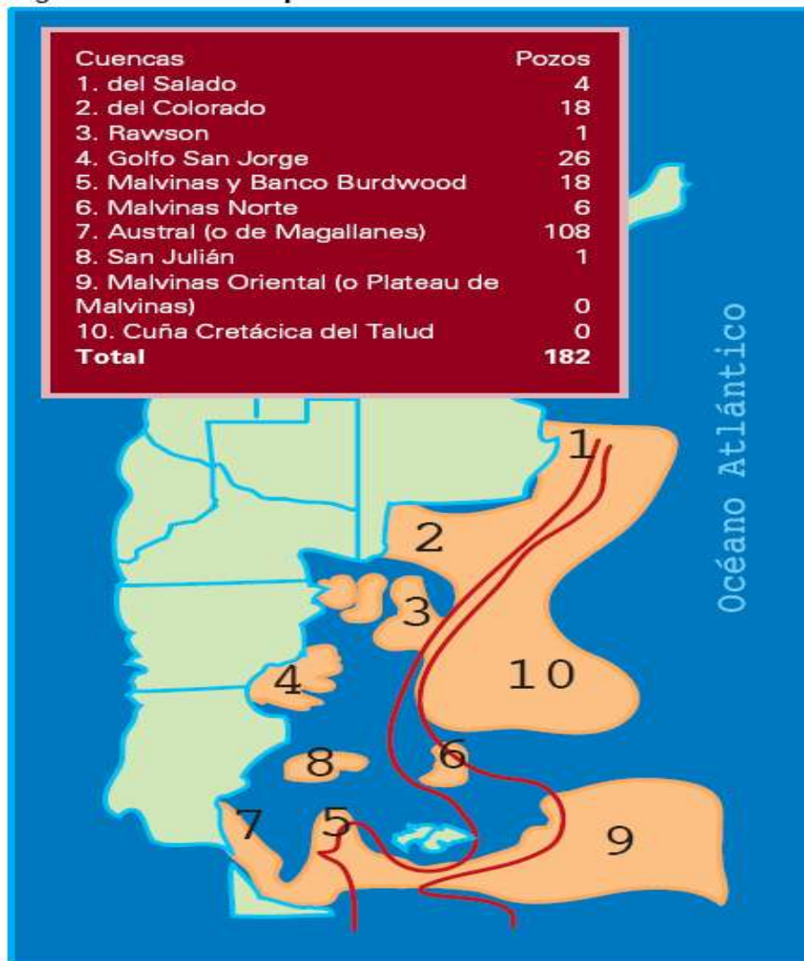
Figura 1. Pozos de exploración en cuencas offshore.