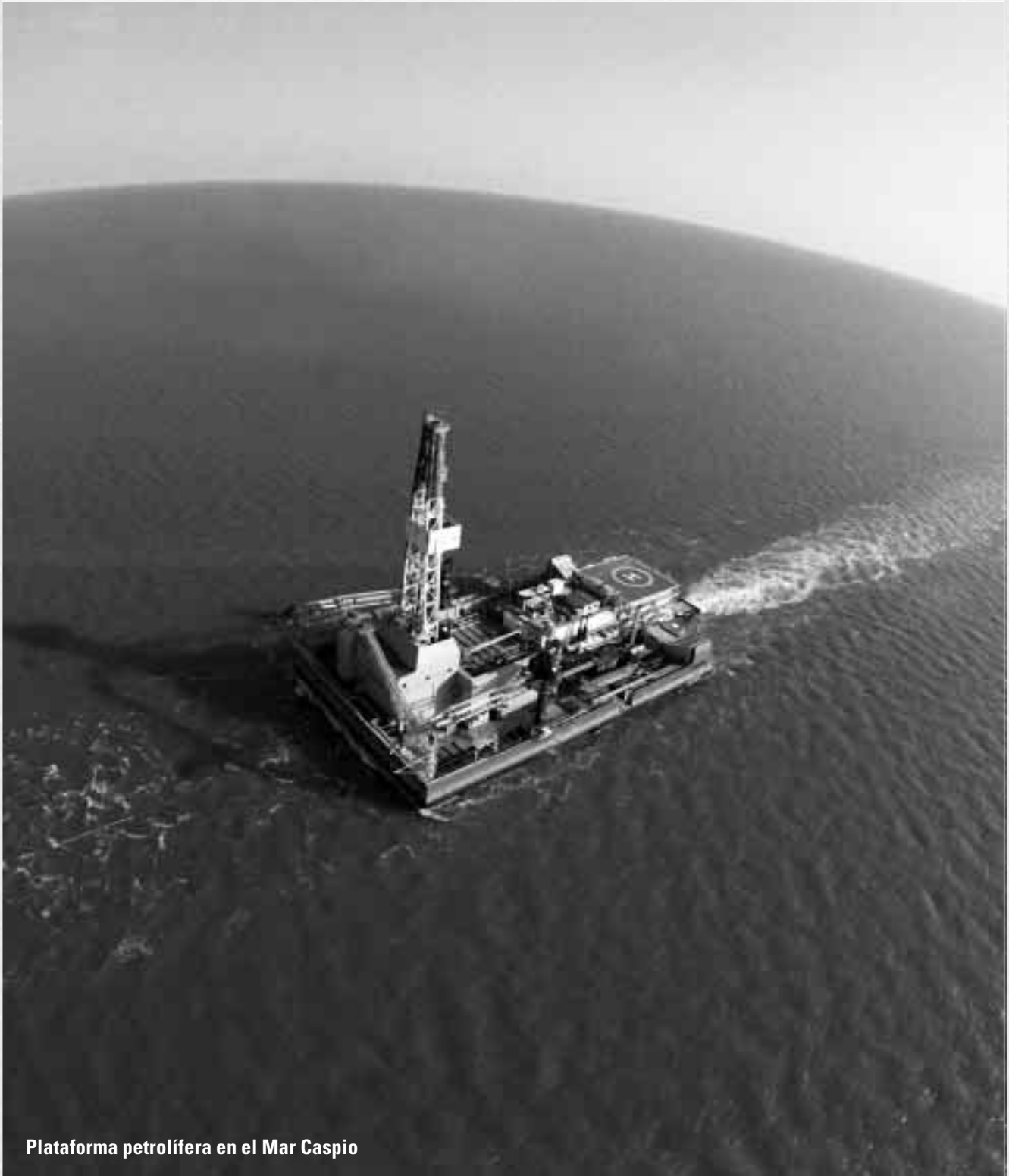
Plataforma petrolífera en el Mar Caspio

se exploren con una intensidad pareja a la de Norteamérica y el sector del golfo de México de EE UU, no veo ninguna razón persuasiva para preferir la estimación más conservadora del petróleo convencional recuperable ofrecida por la Campbell&Company (no más de 1,8 billones de ba-