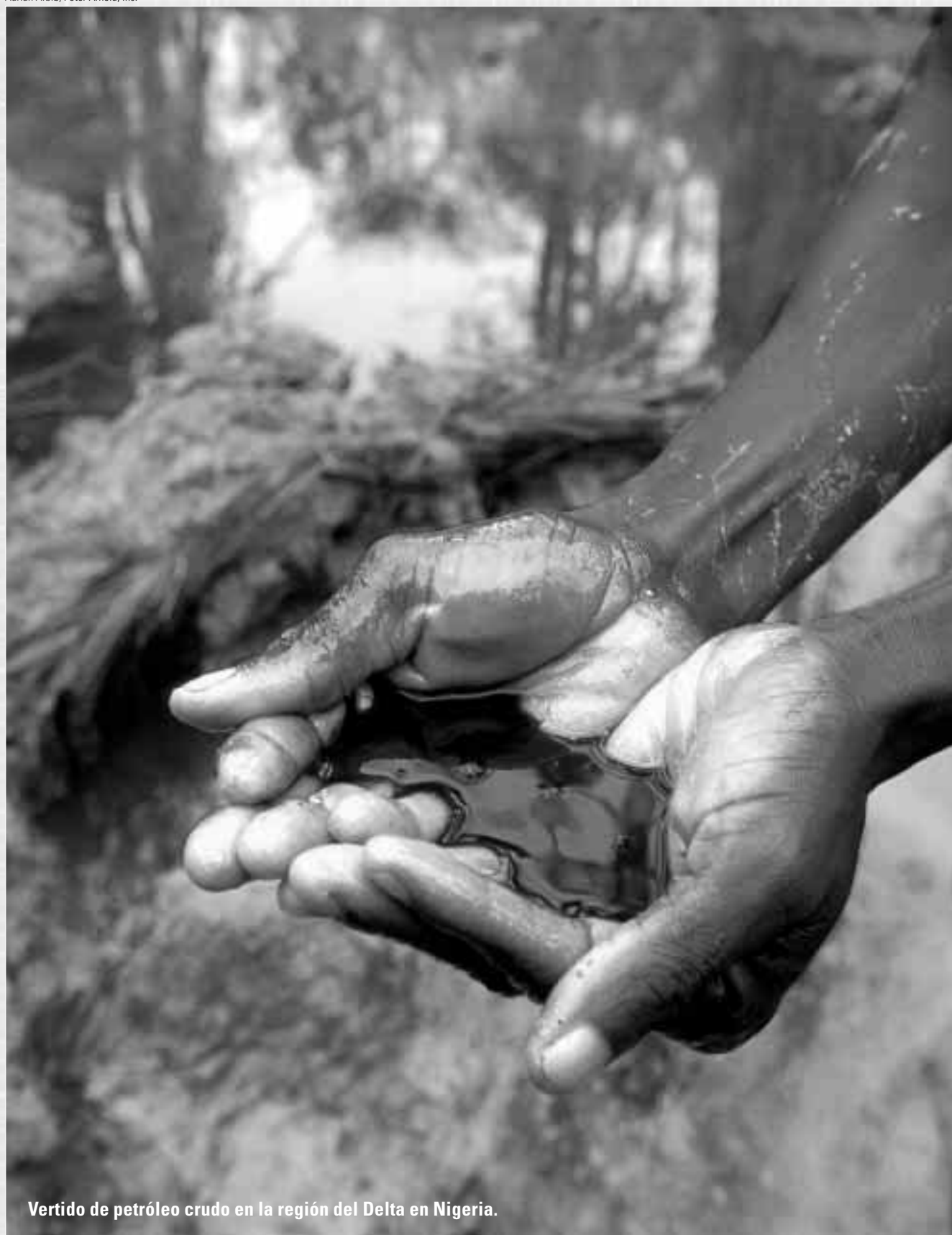
Vertido de petróleo crudo en la región del Delta en Nigeria.