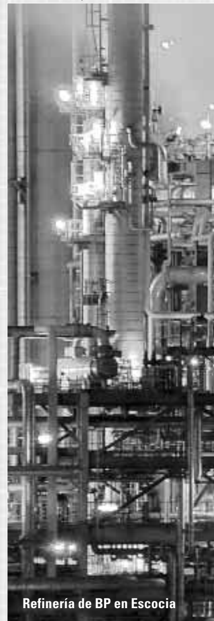
Refinería de BP en Escocia