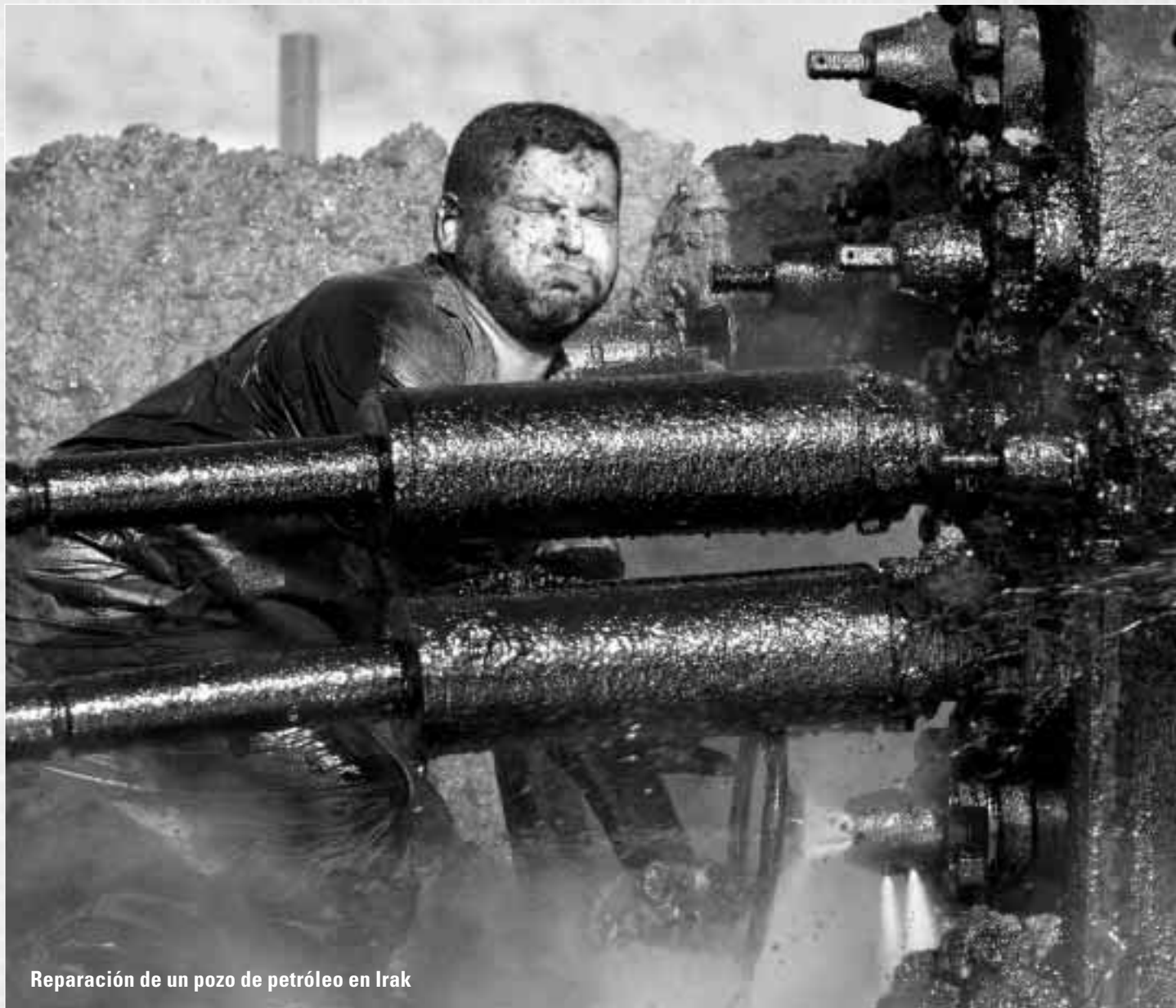
Reparación de un pozo de petróleo en Irak

descubrir y técnicamente recuperable. El USGS señala que, puesto que el petróleo es la fuente más importante desde hace cerca de 100 años, se han extraído 539.000 millones de barriles de petróleo fuera de Estados Unidos. El USGS estima que hay otros 649.000 millones de barriles de petróleo sin descubrir y técnicamente recuperables fuera de Estados Unidos. Pero, y lo más importantemente, el USGS también estima que hay otros 612.000 millones de barriles adicionales por el “aumento de las reservas en los yacimientos conocidos”, cifra que casi iguala a los recursos sin descubrir. El aumento de las reservas se debe a una variedad de causas, entre las que destacan los avances tecnológicos de la exploración y la producción, el aumento de las estimaciones conservadoras de las reservas y los cambios económicos.