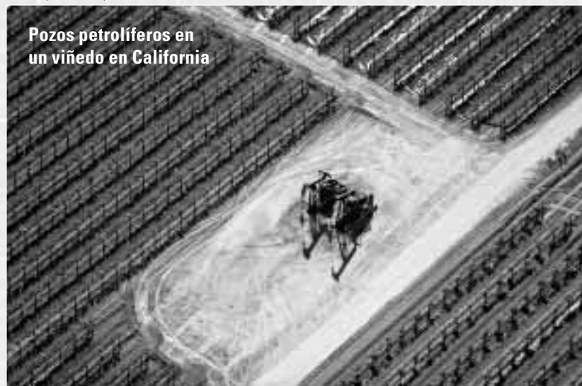
Pozos petrolíferos en un viñedo en California

te por expertos independientes, como ya se requiere a las grandes compañías privadas como ExxonMobil y Shell.