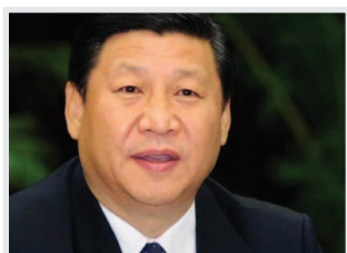
Xi Jinping, nuevo secretario general del PCCh