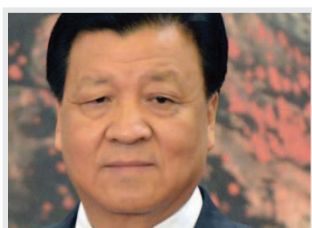
Liu Yunshan, elegido miembro del CPBP