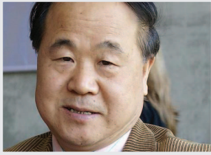
Mo Yan, premio Nobel de Literatura 2012