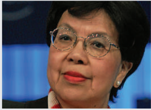
Margaret Chan, reelegida al frente de la OMS