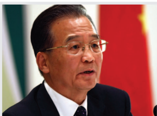
Wen Jiabao, que hizo testamento político en la sesión anual de la APN