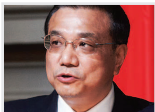
Li Keqiang, reelegido miembro del CPBP