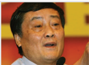
Zong Qinghuo, dueño de Wahaha, el más rico de China