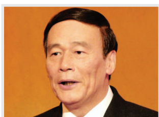
Wang Qishan, elegido miembro del CPBP