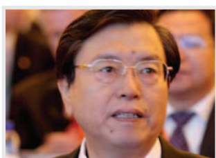
Zhang Dejiang, elegido miembro del CPBP