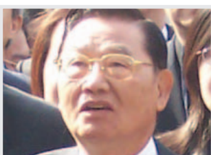
Chiang Pin-kung, presidente de la SEF que dimitió por razones de edad