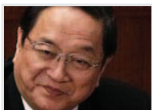
Yu Zhengsheng, elegido miembro del CPBP