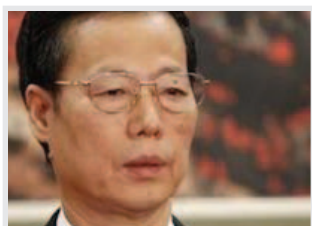
Zhang Gaoli, elegido miembro del CPBP