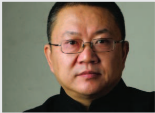
Wang Shu, premio Pritzker de arquitectura