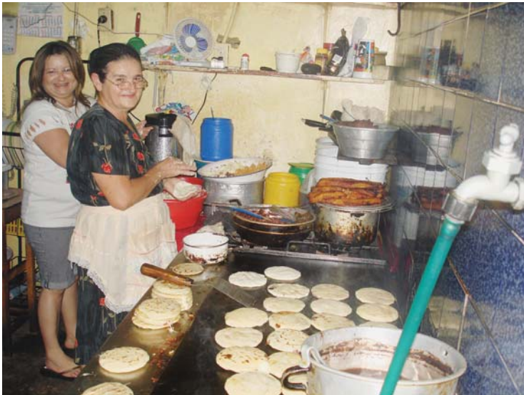
Elaboracion tortillas, Santa Tecla.