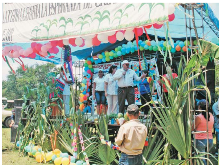
Festival del maíz, Bajo Lempa