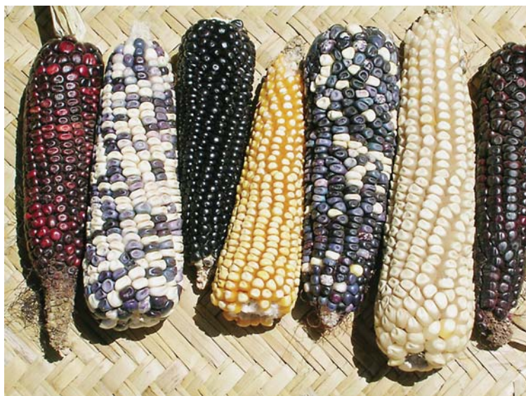
4 colores del maíz