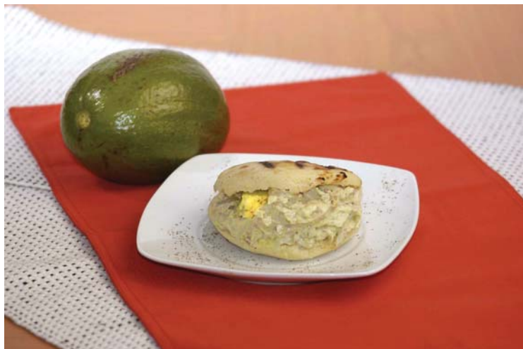
Arepa reina pepeada.