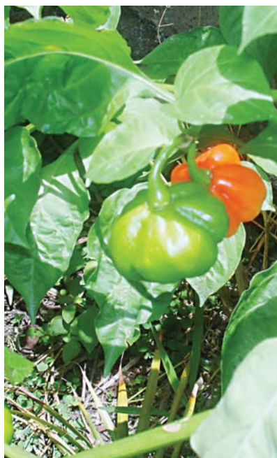
Aji dulce plantado en la embajada de Venezuela.