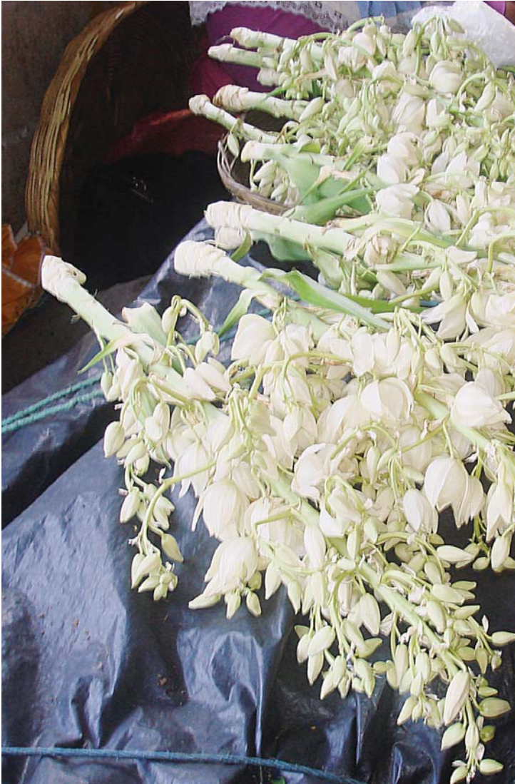
flor de izote.