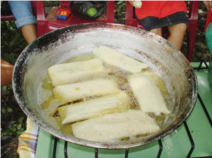
Tamales fritos, Bajo Lempa.