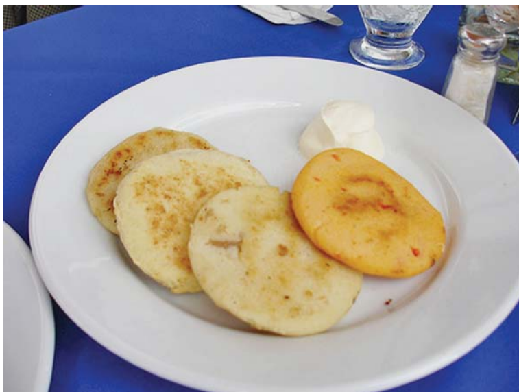
Arepas con crema.