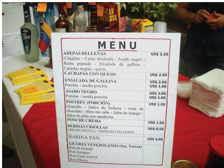
Menú Venezuela, festival gastronómico, 2007.