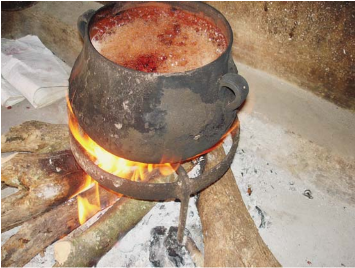
frijol rojo en leña, casa de Elba Benitez.