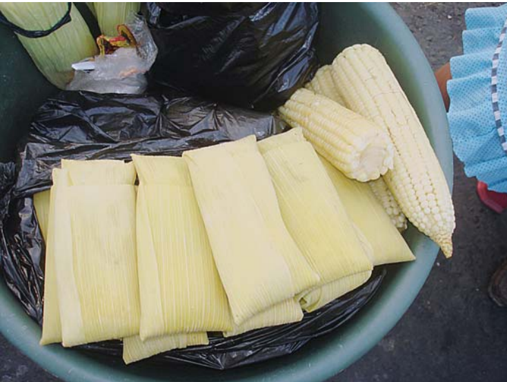
Tamales de elote, Santa Tecla.