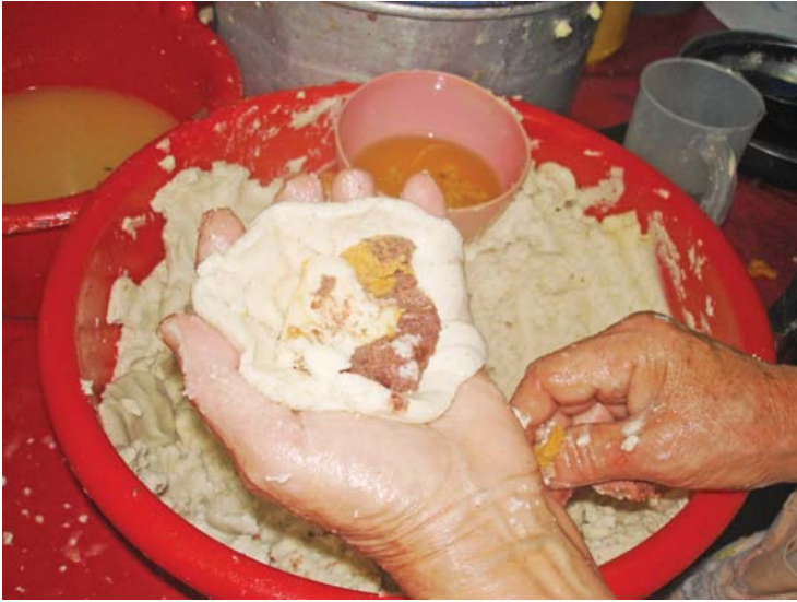
Elaboración de la pupusa.