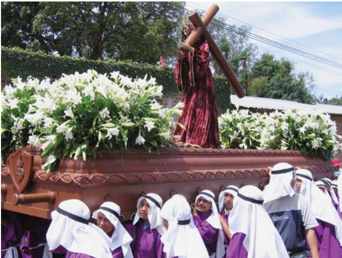
Procesión en Apaneca (2007).