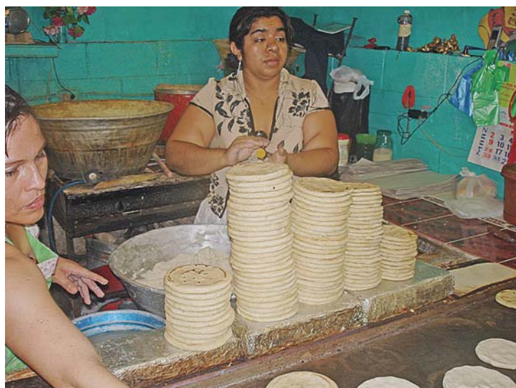
Elaboración de tortillas.