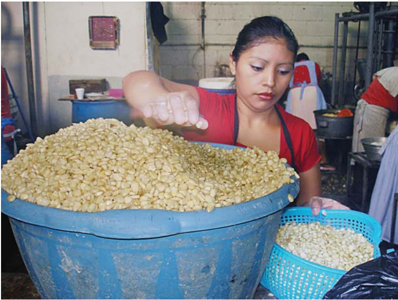
Joven trasladando el maíz