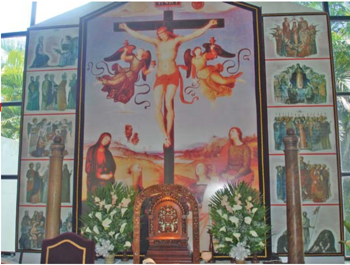
Vitrail en iglesia Santa Elena.