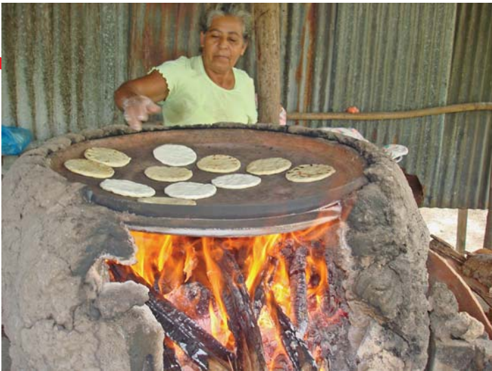
Tortillas hechas con leña.