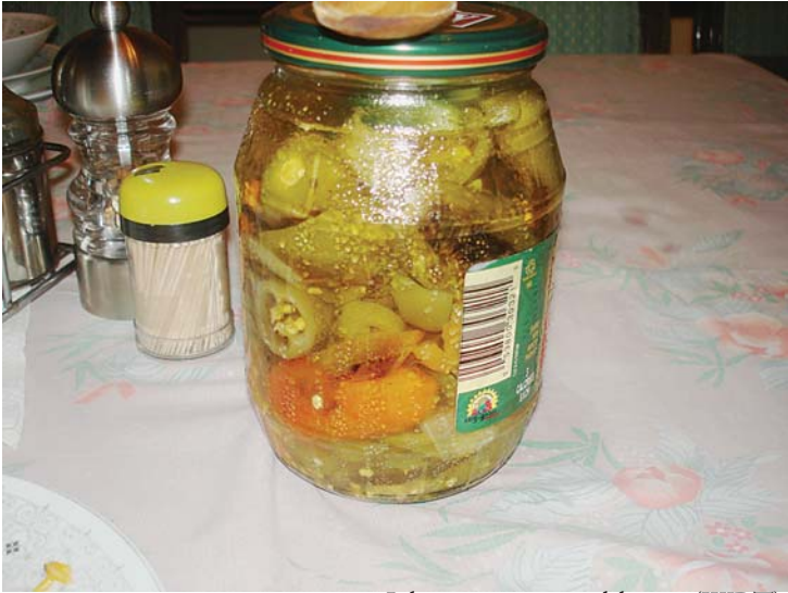
Jalapeño con ron blanco (WRT).