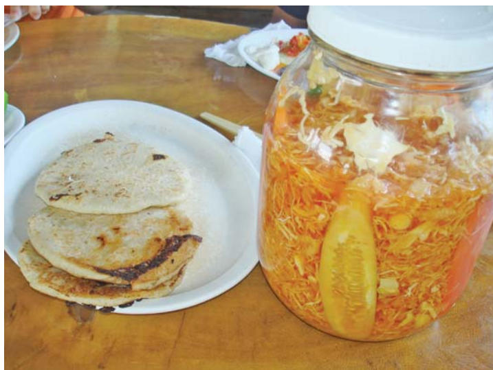
Pupusas y curtido.