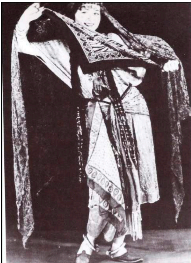
Figura 5. La Meri bailando “una danza del Maghreb”, 1930.

Las palabras precedentes pertenecen a La Meri (nombre artístico de Russel Meriwether Hughes) quien, atraída por “La danza de los cinco sentidos” de St. Denis, en 1915 viajó a diferentes países orientales para estudiar sus danzas, para luego, junto a aquélla, fundar un estudio