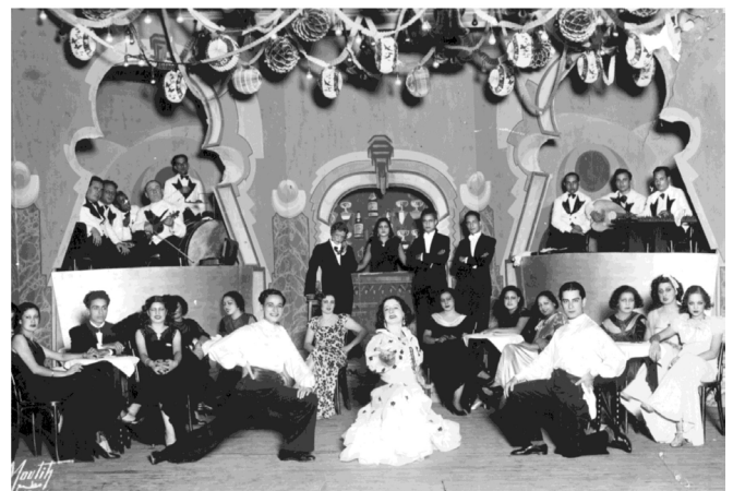
Figura 2. El Casino Badia y sus artistas.

Este moralismo se erguía como protector de los cuerpos femeninos que consideraba bajo su tutela, mientras el cuerpo colonizado de la mujer se convirtió en espectáculo público sólo para las élites y su impronta colonialista.