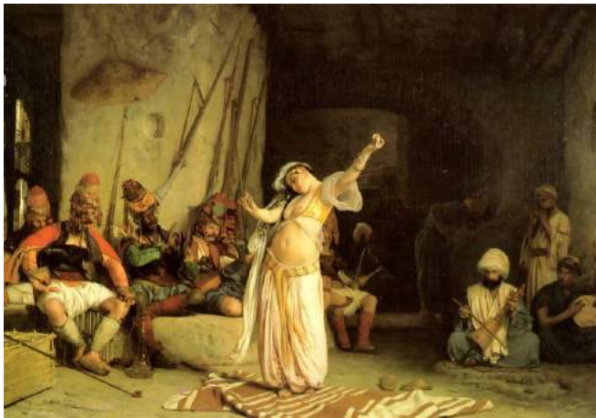
Figura 1. Gérôme, Danza de la alima.

La lectura que se hizo en ese momento de la alima de Gérôme queda plasmada en las palabras del crítico de arte Edward Strahan, según el cual “la presencia de los soldados sentados con una mirada que enfatiza la degradación de la sociedad oriental, las bases del sistema familiar, el desprecio brutal de las mujeres, los horrores de una religión carnal. Aquí, con un vigor nunca antes visto, somos transportados físicamente entre mujeres sin alma, y devotos que se permiten estudiar las danzas de las awalem como una imagen certera del paraíso” (Strahan, 1879: 80).