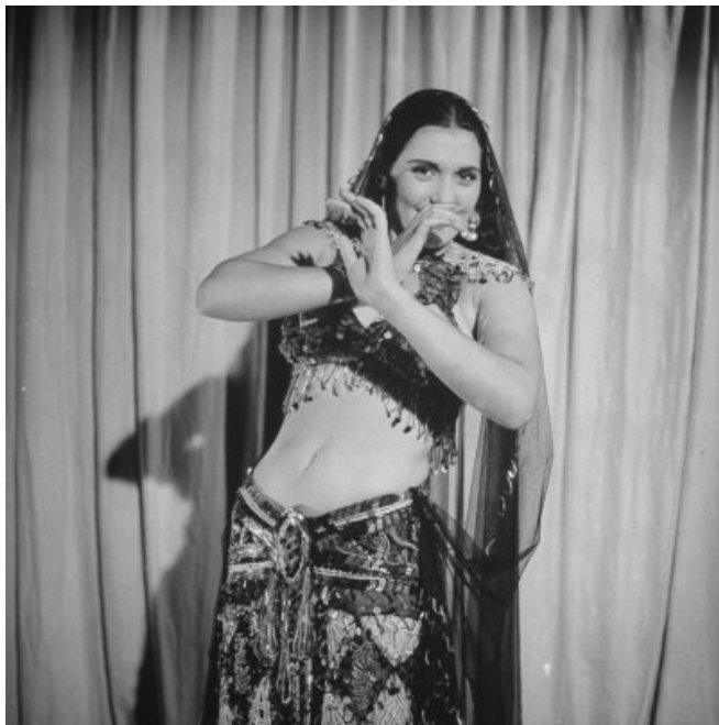
Figura 3. Tahia Carioca en el Casino Badia vistiendo el traje de dos piezas, circa 1940.

Así, se cimentaba con esta percepción la relación del artefacto colonial “danza oriental” con la identidad nacional y con ella la reapropiación de los cuerpos femeninos colonizados.