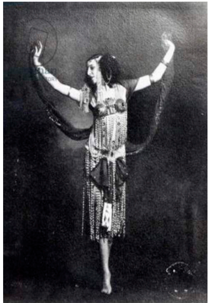
Figura 6. Ida Rubinstein con el vestuario de una presentación privada de Salomé en 1908 durante la que interpretaba la danza de los siete velos hasta desnudarse completamente. Fuente: http://www.bridgemanart.com . (Consulta: 05/04/2014).