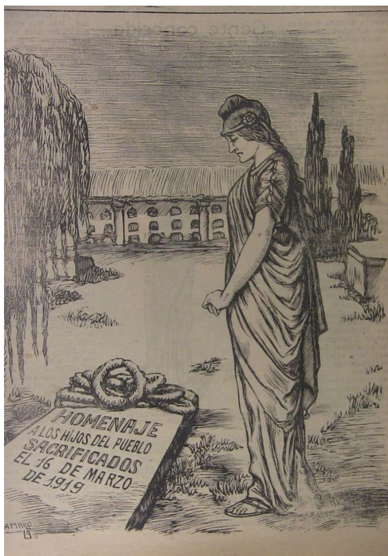
Bogotá Cómico, No. 86, abril 19 de 1919.