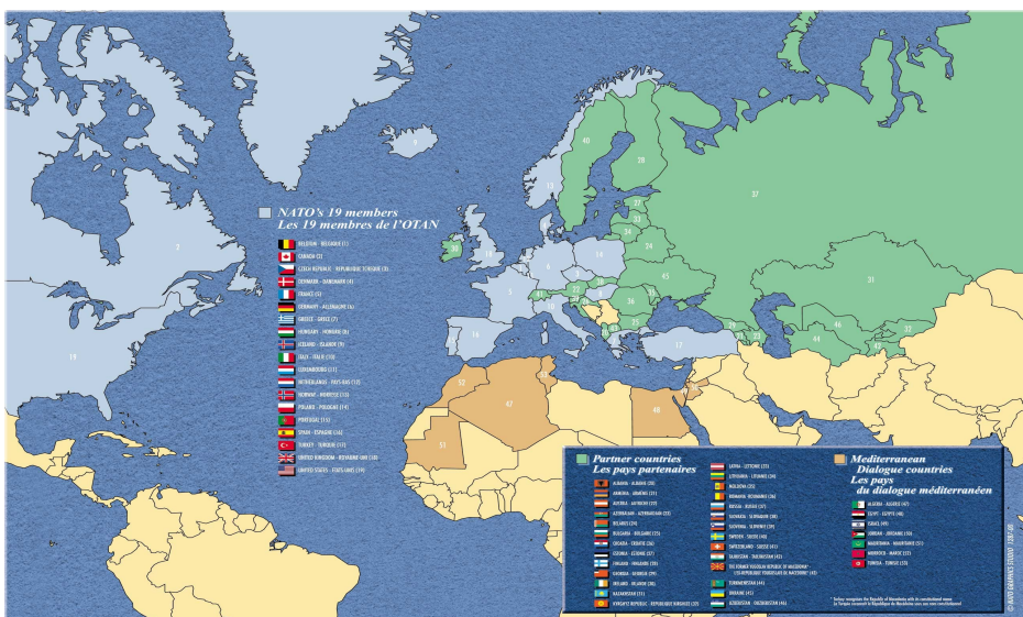
Mapa de las Asociaciones de la OTAN

Entre estos países figuran algunos que carecen de costa en el Mediterráneo, como Mauritania y Jordania. Pero estos últimos tienen la ventaja de formar parte del Diálogo Mediterráneo de la OTAN. Creada en 1994, esta iniciativa de cooperación de la OTAN reagrupó en un primer momento a Egipto, Israel, Jordania, Mauritania, Marruecos y Túnez. A continuación se unirán Jordania [sic] (1997) y Argelia (2000). La iniciativa permite sobre todo lograr el envío de tropas egipcias, marroquíes y jordanas al seno de las Operaciones de Mantenimiento de la Paz llevadas a cabo por la OTAN en Bosnia y Kosovo [1]. En 2004 la OTAN lanzó una nueva iniciativa de cooperación, esta vez en Turquía. Se trata de la Iniciativa de Cooperación Estambul ( Istanbul Cooperation Initiative, ICI ) que accesoriamente operó la unión del Consejo de Cooperación de Golfo con la OTAN [2]. Esta iniciativa es una extensión del Diálogo Mediterráneo, al que es idéntico dejando de lado su objetivo geográfico, que es el Golfo Pérsico. Ambas iniciativas se refuerzan progresivamente con la creación de la Unión para el Mediterráneo.