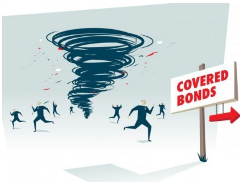
Il·lustració 1: el torbellino de las cédulas hipotecarias

He aquí, por cierto, la raíz del brutal aumento de la desigualdad”. El resumen que hace Husson de la génesis de la financiarización es inmejorable. “De este modo, la falta de oportunidades para sostener una acumulación rentable, a pesar de la recuperación de los niveles de ganancia gracias a la ofensiva neoliberal sobre los trabajadores, movilizó una masa creciente de rentas financieras en busca de valorización: allí es dónde se encuentra la fuente del proceso de financiarización”. Esa “masa creciente de rentas en busca de valorización” fue la que colapsó en el crack de 2008 al secarse la fuente de la que manaba su liquidez: la insuficiente capacidad de pago de millones de trabajadores sobreexplotados y endeudados hasta las cejas. Tras el colapso, la élite neoliberal-monetarista diseñó una política a la medida -opuesta a los estándares keynesianos de inversión y gasto público para reactivar la demanda agregada- de la recuperación de la rentabilidad del apéndice parasitario-financiero que pilota con mano de hierro la economía mundial. El símbolo de esa política de salvamento masivo de la gran banca a través de la reactivación de las burbujas de activos y el reinicio de la maquinaria de creación de entelequias especulativas lo representa la política monetaria expansiva de la banca central mundial.