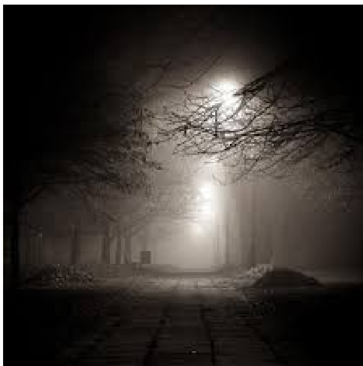
– perdiendo el rastro de los fondos en la bóveda del BCE –

E ntremos en materia y expliquemos el modus operandi de la colosal trapacería -ni más ni menos que la nacionalización encubierta de la banca privada en una supuesta economía de libre mercado-descrita anteriormente. Si miramos la mayoría de las Gestoras de fondos de titulización hipotecaria , donde se revende su deuda, observamos que hay una gran cantidad de fondos liquidados anticipadamente que se corresponde con la crisis iniciada en el 2008. Desde el 2010 sólo el Banco Popular y su absorbido Banco Pastor han extinguido o liquidado 35.360 millones de euros en la web de InterMoney, su sociedad de gestión de Titulización.