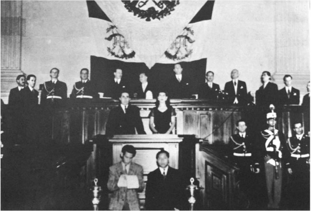
Toma de posesión del Doctor Juan José Arévalo