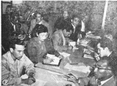
Ayer se celebró la inauguración de la Asamblea Nacional de Secretarios Generales Departamentales del Sindicato de Trabajadores de la Educación, en esta ciudad, de cuyo acto son las presentes fotografías. La superior, es del grupo de directivos que presidieron la reunión inicial y la de abajo recoge un aspecto de las comisiones que están laborando activamente en este congreso