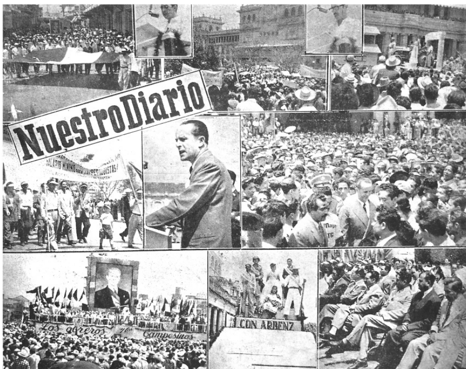
Ofrecemos la presente composición fotográfica correspondiente al gradioso desfile con que las fuerzas obreras y campesinas, así como otros sectores democráticos del país, celebraron el Día Internacional de Lucha de los Trabajadores. En raras ocasiones se había experimentado un entusiasmo tan grande como el manifestado por la ciudadanía el día de ayer. Más de cincuenta mil ciudadanos desfilaron por las calles de la ciudad presentando algunas de sus demandas y saludando las patrióticas actitudes tomadas por el gobierno presidido por el Coronel Jacobo Arbenz G., en defensa de la soberanía nacional y de los intereses de los trabajadores. Insertos aparecen: El Presidente de la República, Coronel Jacobo Arbenz, y los profesores Víctor Manuel Gutiérrez y Leonardo Castillo Flores, Presidente y Vicepresidente, respectivamente del Comité Pro Primero de Mayo.