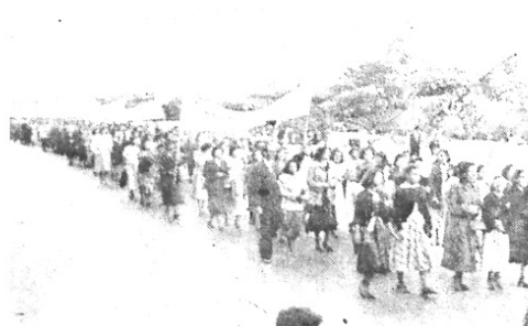
De la manifestación llevada a cabo la tarde de ayer por los maestros sindicalizados de esta capital, en protesta por no haberles sido cancelados en su oportunidad los sueldos de vacaciones. Arriba: Un grupo de directivos del STEG.