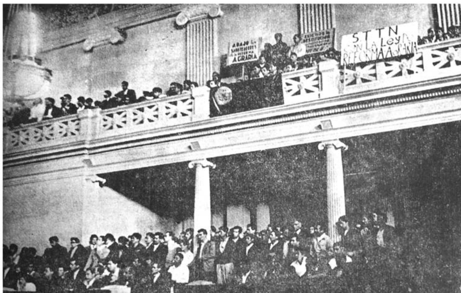
La nutrida barra formada anoche en el recinto de sesiones del Congreso Nacional, compuesta en su mayoría por gente del pueblo, aplaudió con entusiasmo la actuación de los diputados revolucionarios que anoche, en su memorable reunión permanente del alto organismo, defendieron el derecho de las grandes mayorías populares.