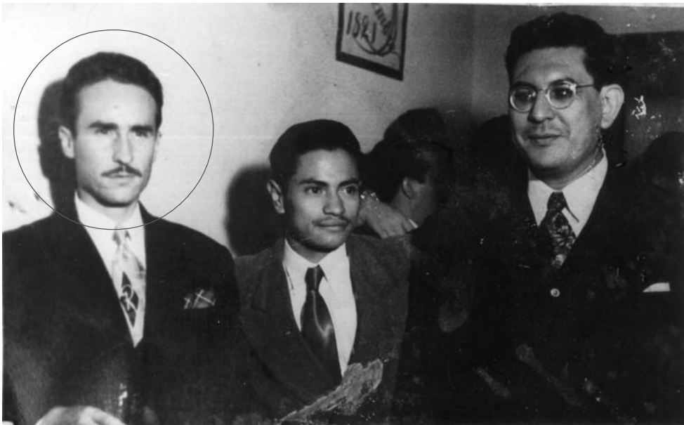
Rafael Tischler, maestro, sindicalista y revolucionario.