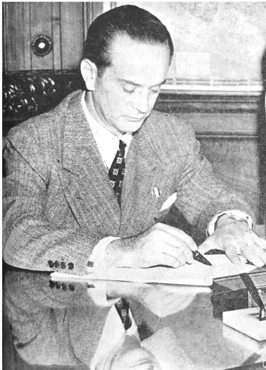
El momento histórico del 17 de junio de 1952, cuando el ciudadano presidente, Coronel Jacobo Arbenz Guzmán, consecuente con las aspiraciones de su pueblo, firma el decreto novecientos (Ley de Reforma Agraria), haciendo una realidad la promesa hecha en su campaña presidencial.