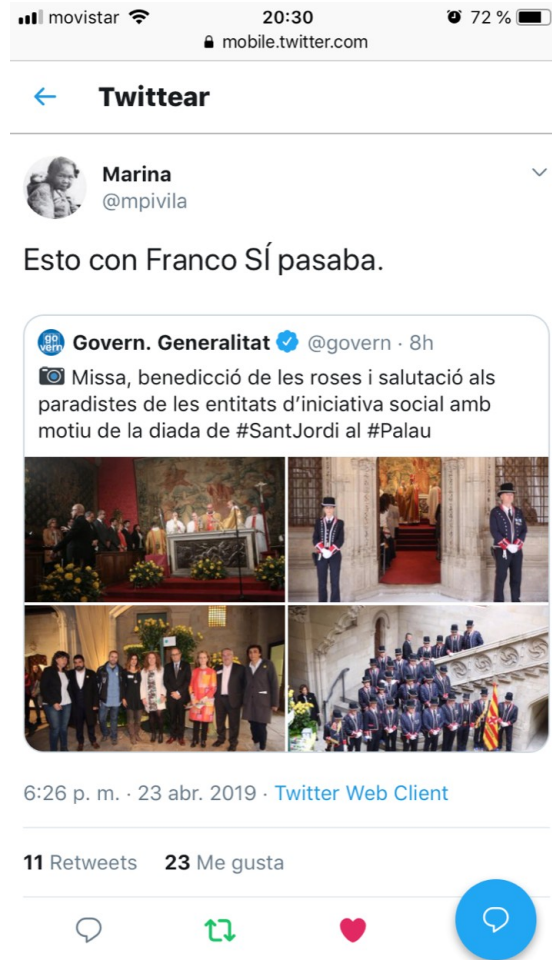
[Misa, bendiciones de rosas y saludos a las paradas de las entidades de iniciativa social con motivo de la Diada de Sant Jordi al Palau]

3. En muchas partes se cuecen mal las habas, no sólo en Coripe, y sin ningún ánimo de disculpar una “tradición” que no puede ser disculpada ni aceptada. ¡Es una barbaridad porque es una barbaridad... y de muy mal gusto!