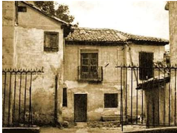
Casa Museo de Antonio Machado, Segovia

Quien, en importantes poemas de Campos de Castilla , de 1912, no tiene reparos en señalar la ruindad moral del pueblo campesino, ahora, años después y en Baeza (es decir, en la España andaluza), proclama la superioridad moral del pueblo ante una “burguesía algo beocia” y “una aristocracia demasiado rural”. En otro pasaje resalta las virtudes artísticas del pueblo, inexistentes, en 1912, en las gentes populares de determinadas tierras sorianas, las que le dictaron aquel contundente verso: “y atónitos palurdos sin danzas ni canciones”. Ahora está ante otro pueblo, éste: “Si vais para poetas cuidad de nuestro folclore. Porque la verdadera poesía la hace el pueblo. Entendámonos: la hace alguien que no sabemos quién es o que, ven último término, podemos ignorar quién sea sin el menor detrimento de la poesía (IV, 2121).