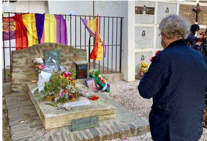
El hispanista Ian Gibson