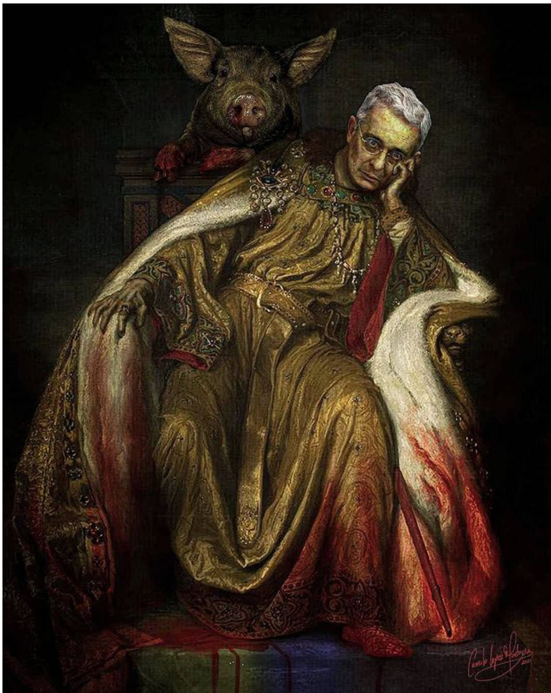
“La ignorancia y el oscurantismo en todos los tiempos no han producido más que rebaños de esclavos para la tiranía.” Emiliano Zapata. Obra de arte digital: Camilo López Montoya