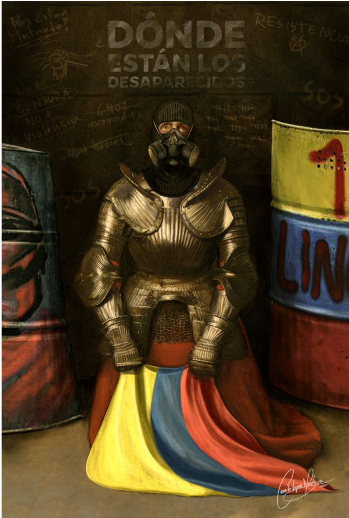
“En Colombia, la pregunta es: ¿Quién nos va a matar?, ¿Los guerrilleros, los paramilitares, los narcos o los políticos?” Jaime Garzón. Obra de arte digital: Camilo López Montoya