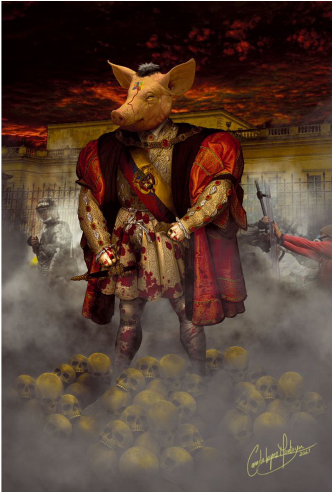
El poder ha abusado de la ciudadanía, Colombia despierta, Colombia resistente. Obra de arte digital: Camilo López Montoya