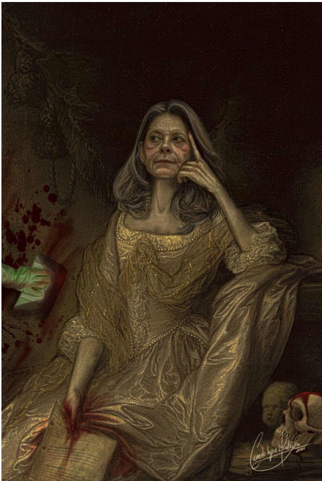
“Lo que más irrita a los tiranos es la imposibilidad de poner grilletes al pensamiento de sus subordinados” Paul valéry. Obra de arte digital: Camilo López Montoya