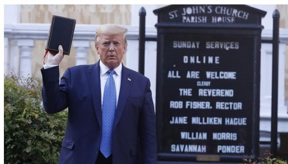
El presidente posa con la Biblia frente a la iglesia St Johns', cerca de la Casa Blanca.