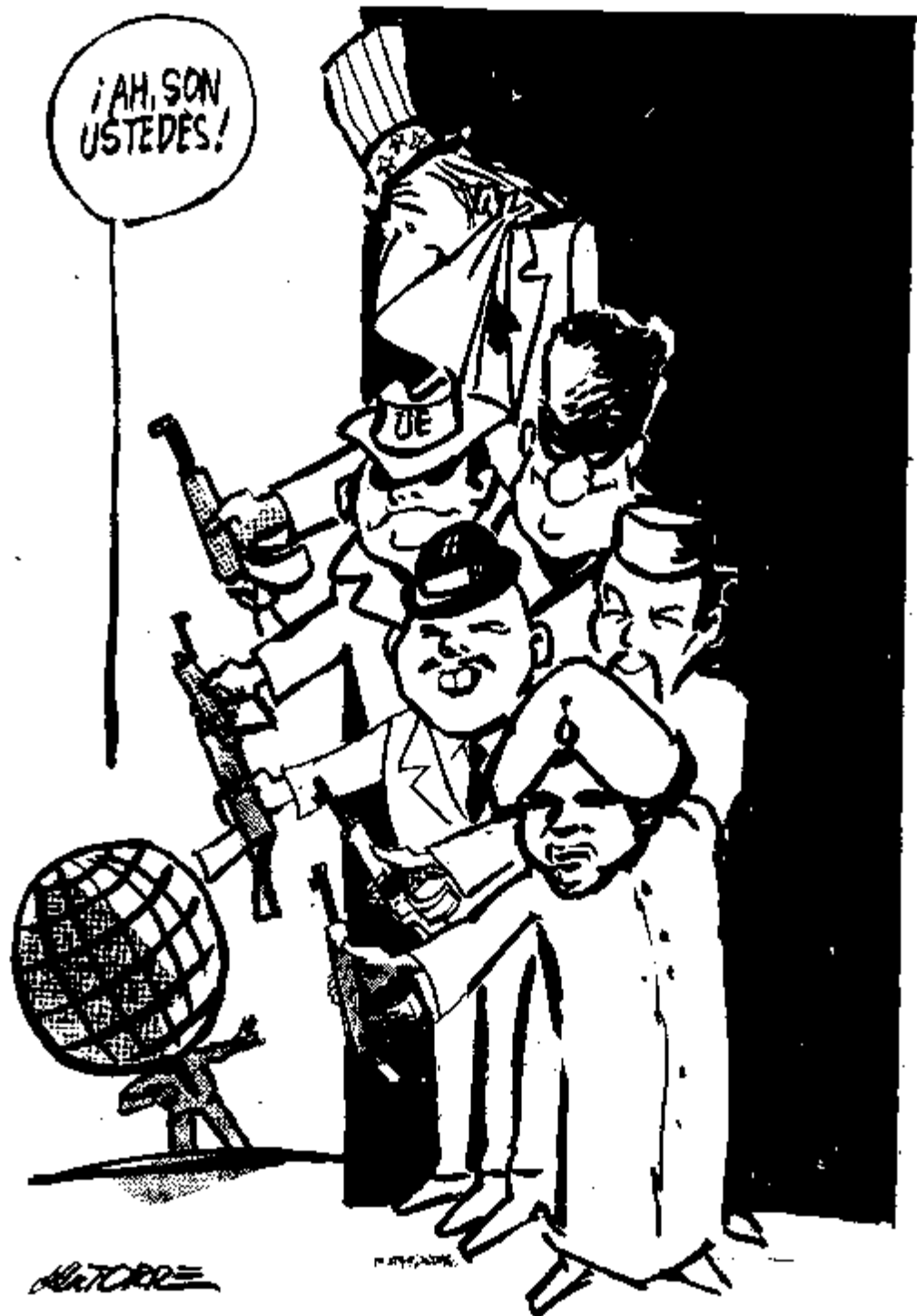
Caricatura inspirada en la Característica de la Decadencia Social . Fuente: De la Torre, Excélsior , 1 de octubre de 2000