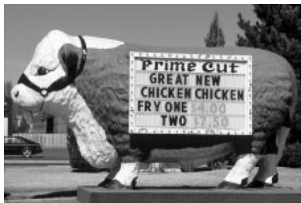
Jochen Tack/Peter Arnold

¿Cómo es que un tema aparentemente pequeño como el consumo individual de carne ha pasado tan rápidamente de los márgenes de la discusión sobre la sostenibilidad al