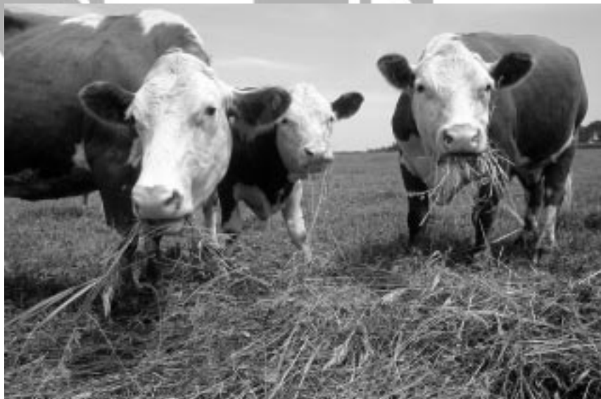
Peter Frischmuth/Peter Arnold

► Los informes del Center for International Forestry Research señalan que el rápido crecimiento en las ventas