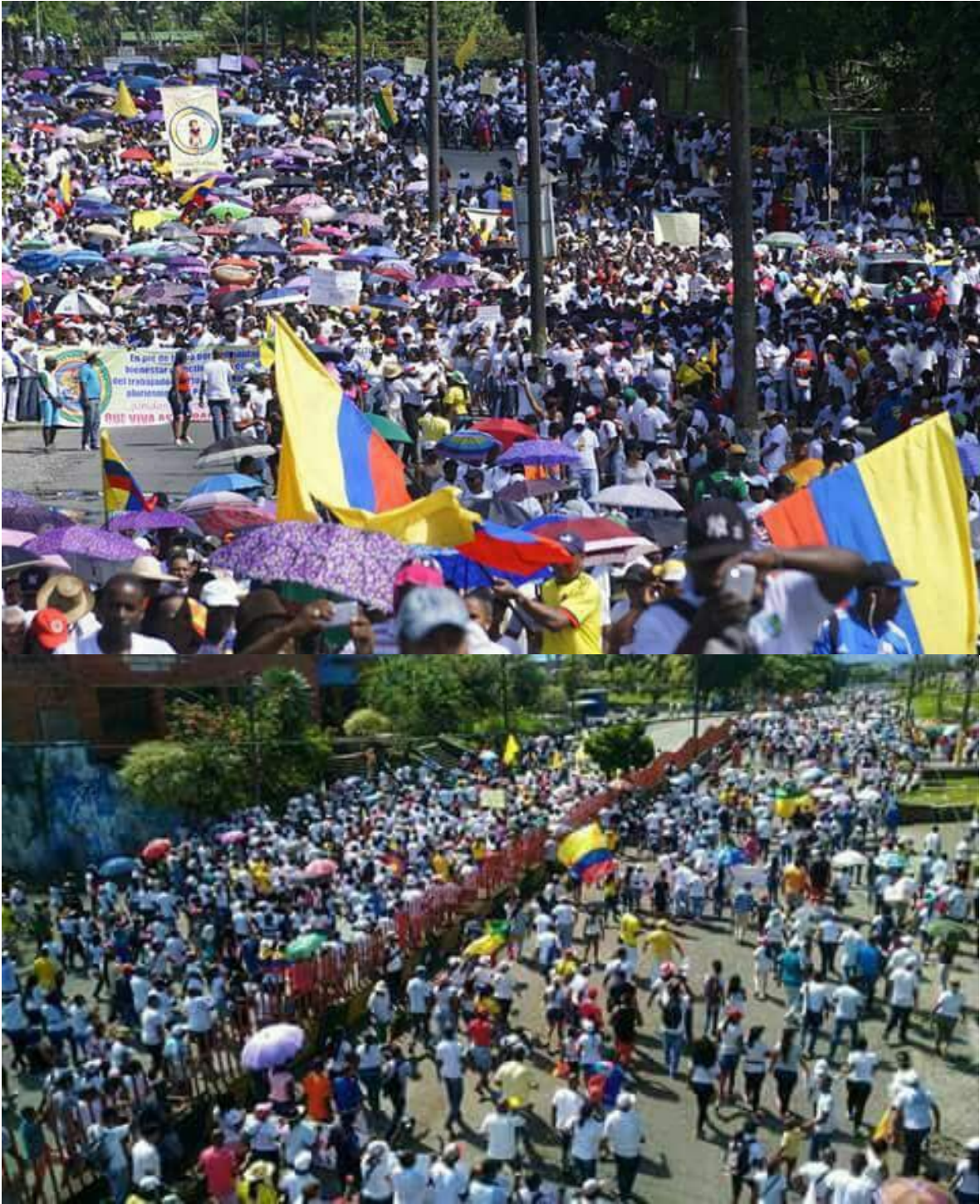
Movilización de comunidad de Buenaventura día 17 de Mayo de 2017.