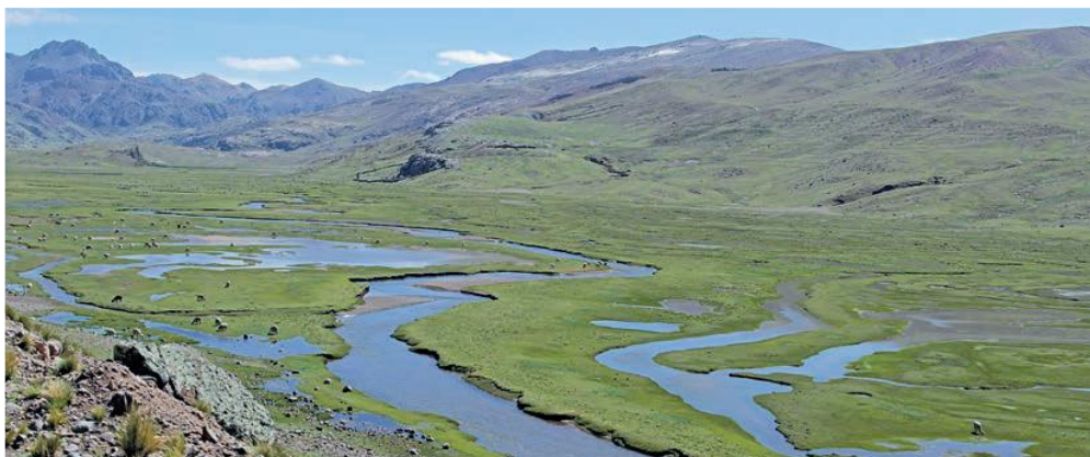
Cusco, 02 de febrero del 2021. Día Mundial de Humedales.