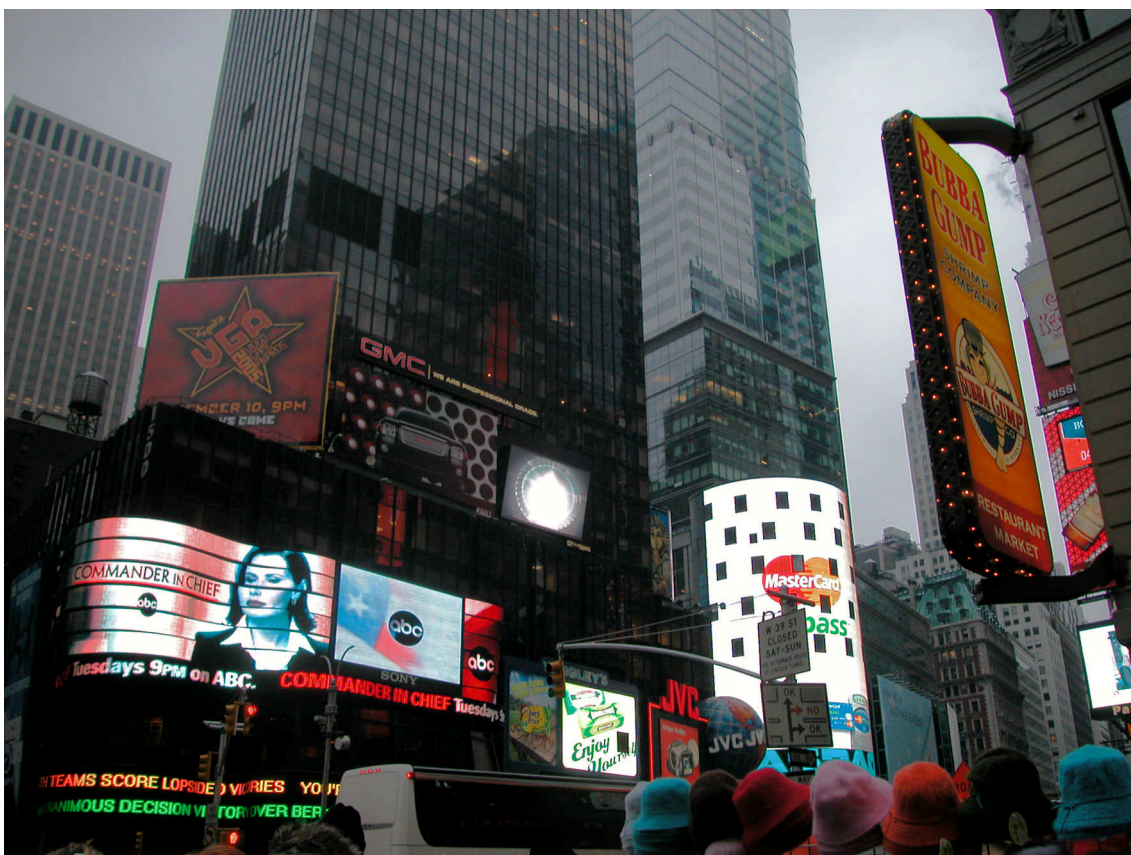
Times Square en Manhattan (Nueva York) en la esquina de Broadway y la Séptima Avenida. Chusa, 2005

interrelacionadas a través de la publicidad y el poder de la imagen. En EEUU, la Sociedad de Consumo por excelencia, el telespectador medio ve unos 30.000 anuncios al año (Mander, 2004), y la situación en otros territorios, tanto centrales como periféricos, va camino de igualar al gigante estadounidense, aunque, eso sí, con distintos ritmos e intensidades. El consumo pues que se expande es principalmente el de las grandes marcas, que han sabido imponer sus Logos a través de una fuerte inversión publicitaria (Klein, 2002). Muchos de alcance mundial. Lo cual les reporta un doble beneficio. Por un lado, amplían su mercado a costa de otras marcas de menor acceso a los medios, o directamente sin acceso a los mismos por su pequeño volumen de negocio. Y por otro, una vez adquirido el tamaño suficiente que les permite salir a Bolsa, son capaces de crear “dinero financiero” (acciones, obligaciones, etc.), y que se acepte como tal en los parqués bursátiles, ante la confianza que inspira una marca que opera en mercados cada vez más globales. Lo cual, a su vez, les posibilita impulsar estrategias de adquisiciones y fusiones para devenir en actores aún más relevantes en los mercados mundiales. Un círculo virtuoso propiciado por el impulso mediático. Ese ha sido el proceso en las últimas décadas de las principales Transnacionales mundiales.