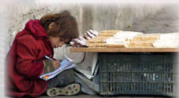
"el reto". Premio 2007 a la Agencia de Noticias Siria

La situación de los refugiados CONCURSO DE RELATOS Palestinos e Iraquíes